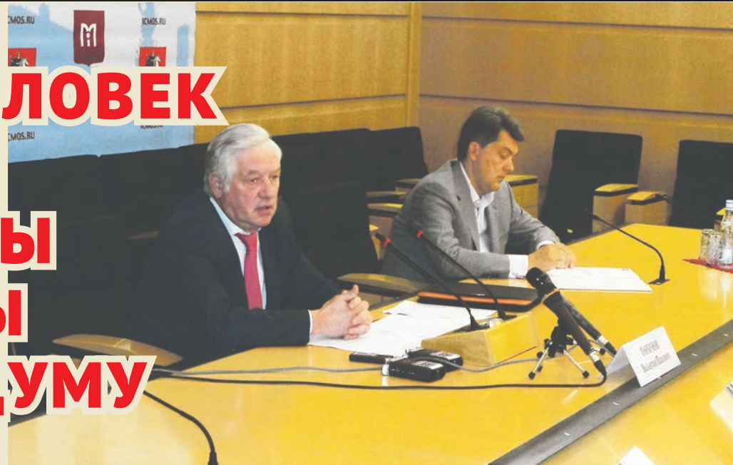
Председатель Мосгоризбиркома Валентин Горбунов (слева) уверен, явка на выборах в МГД составит 30%

Московская городская дума прибавит в весе и будет состоять из 45, а не из 35 депутатов. Увеличение количества депутатских кресел связано с расширением территории города – присоединением Троицкого и Новомосковского округа. Таким образом, на данный момент депутатский конкурс со-