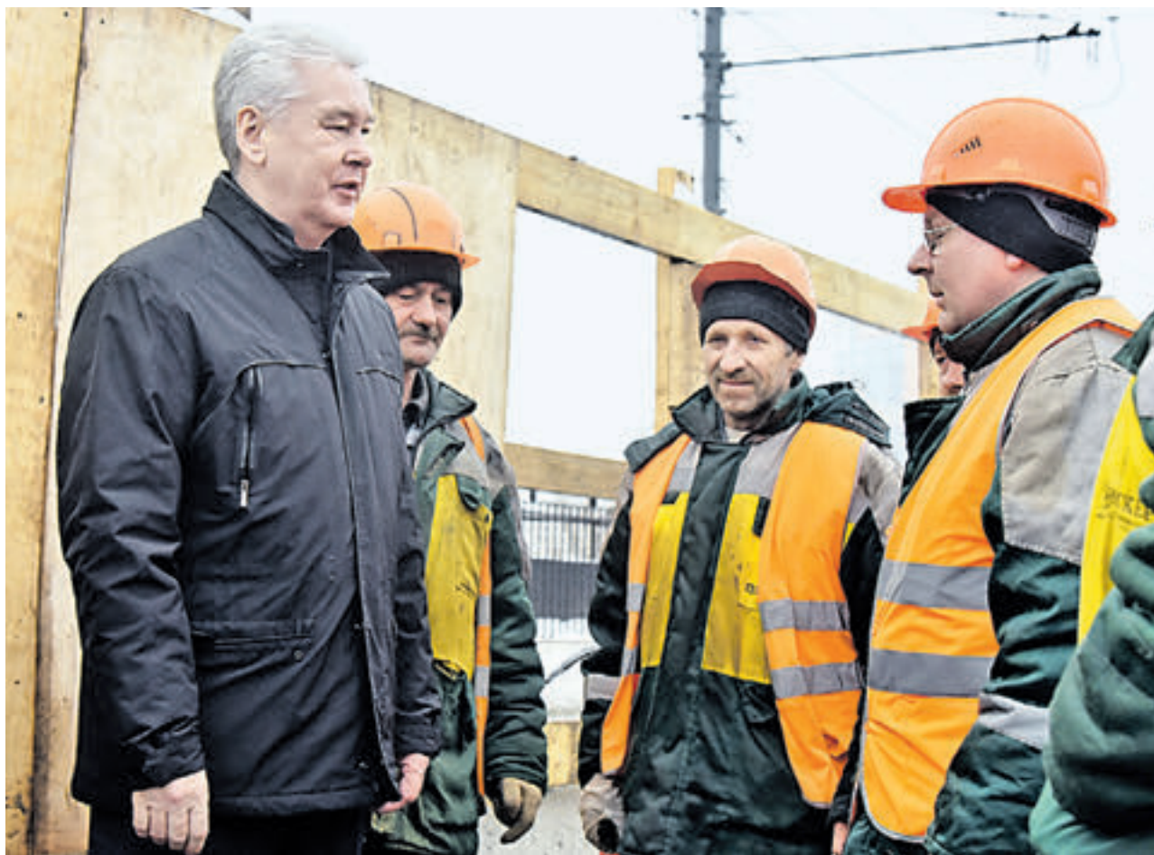
2 марта 2016 года. Мэр Москвы Сергей Собянин беседует с рабочими, ведущими капитальный ремонт Нагатинского метромоста. Работы должны быть завершены через год: их окончания с нетерпением ждут на обоих берегах Москвы-реки

Нагатинский мост не простой мост. Это один из шести столичных метромостов. Построенный в 1969 году, он соединил районы Кожухово и Нагатина, сократив для автомобилистов время в пути примерно на час (раньше с одного берега на другой перебирались по Даниловскому мосту). А заодно мост обеспечил продление Замоскворецкой линии метро на юг — до станций «Коломенская», «Каширская», «Варшавская» и «Каховская». Без капремонта мост простоял 40 лет — срок весьма солидный. Начались разгерметизация деформационных швов, проседание опор, частенько приходилось латать асфальтобетонное покрытие. В последние годы Нагатинский мост был «головной болью» юга Москвы, сковывая движение транспорта и становясь причиной длительных автомобильных заторов. Метросоставляющая моста также изнашивается — провисли металлические перекрытия. Мост надо ставить на ремонт. Причем решение это было принято еще в 2010 году. Однако из-за недобросовестного подрядчика работы так и не начались в тот год. К ремонту приступили лишь прошлым