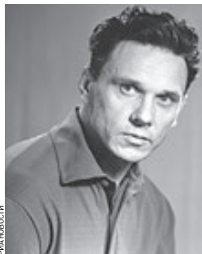
1 октября 1966 года. Народный артист РСФСР Георгий Юматов

Однажды Георгия Александровича спасла пригретая им корабельная дворянка. Она, испугавшись обстрела, прыгнула за борт. Матрос тут же бросился за ней, а в это время в торпедный катер угодила немецкая снаряд, погиб весь экипаж, кроме Георгия Юматова.