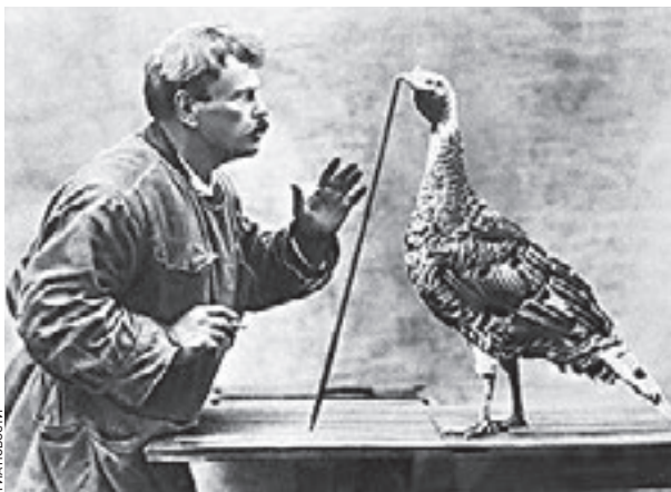
Владимир Дуров ставил психологические опыты на животных, в частности по телепатии, психологии, парапсихологии, гипнозу