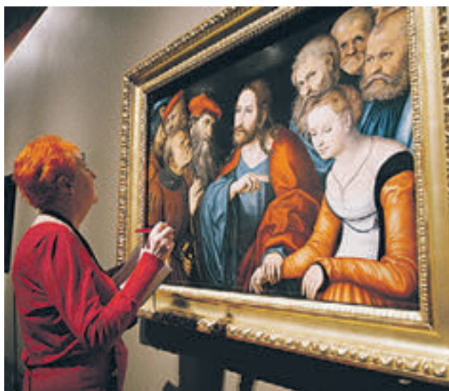
3 марта 2016 года. Выставка работ Лукаса Кранаха Старшего

Подходим к кассе. Фармацевт подносит коробку с супрастином к сканеру, и на табло высвечиваются цифры: 119 рублей 00 копеек. Значит, все в порядке.