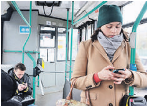
30 сентября 2015 года. Пассажиры троллейбуса маршрута «Б» пользуются бесплатным доступом в интернет

Более 80 процентов московских семей пользуются скоростным доступом в интернет.