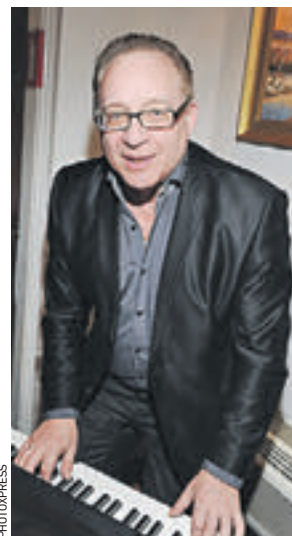
6 марта 2012 года. Максим Дунаевский в Доме литераторов

— Ты что? — я просто обалдел. — Я же не пою. — Вот и отлично, — решил он. — У тебя голос противный, и он соединится с голосом Дурова, вот все и будут уверены, что спел именно актер, а не композитор. Когда они пришли в студию звукозаписи, у микрофона уже сидел Лев Константинович, вспоминал Максим Дунаевский. Актеру разрешили записать номер, потом его перепел композитор. На премьере Дуров не понял, что поет не он. Но получилось же отлично.