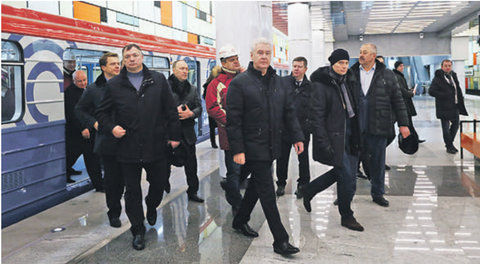
31 декабря 2015 года. Мэр Москвы Сергей Собянин (в центре), заместитель мэра Москвы по вопросам градостроительной политики Марат Хуснуллин (слева) проверили готовность новых станций «Саларьево» и «Румянцево»

Мэр Москвы Сергей Собянин осмотрел станции «Румянцево» и «Саларьево»