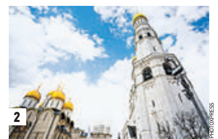
15 февраля 1938 год. Поэт Серебряного века Осип Мандельштам перед арестом (1) Колокольня Ивана Великого (2) Портрет Ивана Великого (3)

ся... Да куда там! Стыдно!» Под куполом колокольни — надпись, что она достроена в царствование Годунова, а именно царь Борис Федорович первым стал посылать русских юношей учиться на Запад. А остальные загадки объясняются тем, что Мандельштам сочинял стихотворение, когда жил на Большой Полянке, а до этого часто посещал район Зарядья.