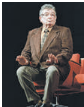
15 октября 1987 года. Народный артист СССР Евгений Весник

— Критику позволяете, товарищ артист? — Простите, вы о чем? — не понял Весник. — У меня программа. — Э нет, не юлите! Кто разрешил проносить со сцены такие словечки? — Ах, эти... — нашелся актер, — это Брежнев утвердил. — Леонид Ильич? — изменился в лице блюстителю порядка. — Так держать, желаю успехов. Оказалось, в прошлом он был важным представителем местных органов.