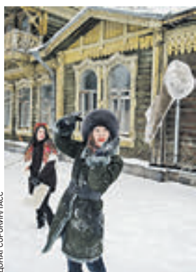
7 января 2015 года. Москвички гадают в Ногинском районе

По русским обычаям в Святки нужно скомоорошничать и гадать. Царь Алексей Михайлович указывал: «...ведомо нам учинилось, что наперед сего в Кремле, и в Китае, и в Белом, и в Земляном городе кликали многие люди Плугу, Каледу и Усень». То есть колядовали. Тусовались, пардон. А как гадать? Например, стоите вы на даче спиной к поленице, тащите одно наугад. Гладкое — муж будет покладистый, сучковатое — склочник попадется. Или по балясинам — лестничным ограждениям. Поднимаетесь и повторяете: вдовец-молодец. На какое слово придется последняя балясина — таков муженек. Что, скажете чушь собачья? А год Огненной Обезьяны великим смыслом наполнен? Да праздник пришел — красивый, веселый. Вот и вся балясина.