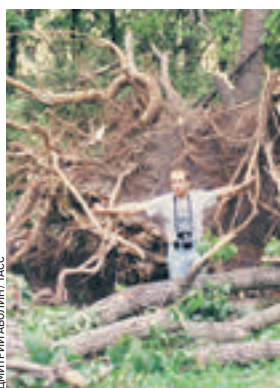
1998 год. Вырванное с корнем дерево на Сретенском бульваре

Имя Стрибога переводится буквально как «дядя отца». Но не это главное. Мировой рекорд по скорости ветра — 408 км/ч или 113 м/с. Он был зафиксирован в 1996 году в ходе тропического циклона Оливия в Австралии. Москву до поры до времени такие рекорды обходили стороной: единственный за время наблюдения ураган зафиксировали в столице 16 июня 1904 года. Тогда скорость ветра достигала 270 км/ч. Досталось зданиям и деревьям. Но в последнее время этот «дядя» распоясался. За последние 30 лет страшный ветер бушевал над Москвой порядка 10 раз. 9 июня 1984 года разогнался до 97 километров в час, через 14 лет 21 июня — до 112 и до 83 — в 2008-м. Судя по всему, Стрибог наконец-то полюбил российскую столицу.