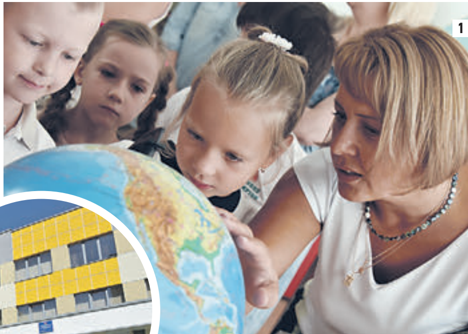
12 августа 2015 года. Первоклашки готовы грызть гранит науки в школе-новостройке № 2031, расположенной на Святоозерской улице района Косино-Ухтомский (1-2)

Одну из новостроек посетил мэр Москвы Сергей Собянин. Это начальная школа, построенная в районе Косино-Ухтомский, на улице Святоозерской. Новое трехэтажное здание расположено на территории школы № 2031, это блок начальных классов, в которые пойдут младшие школьники и нынешние дошколята из соседних домов. Классы нового здания рассчитаны на 300 человек, 12 классов, по три в каждой из четырех параллелей. Возле новостройки градо-