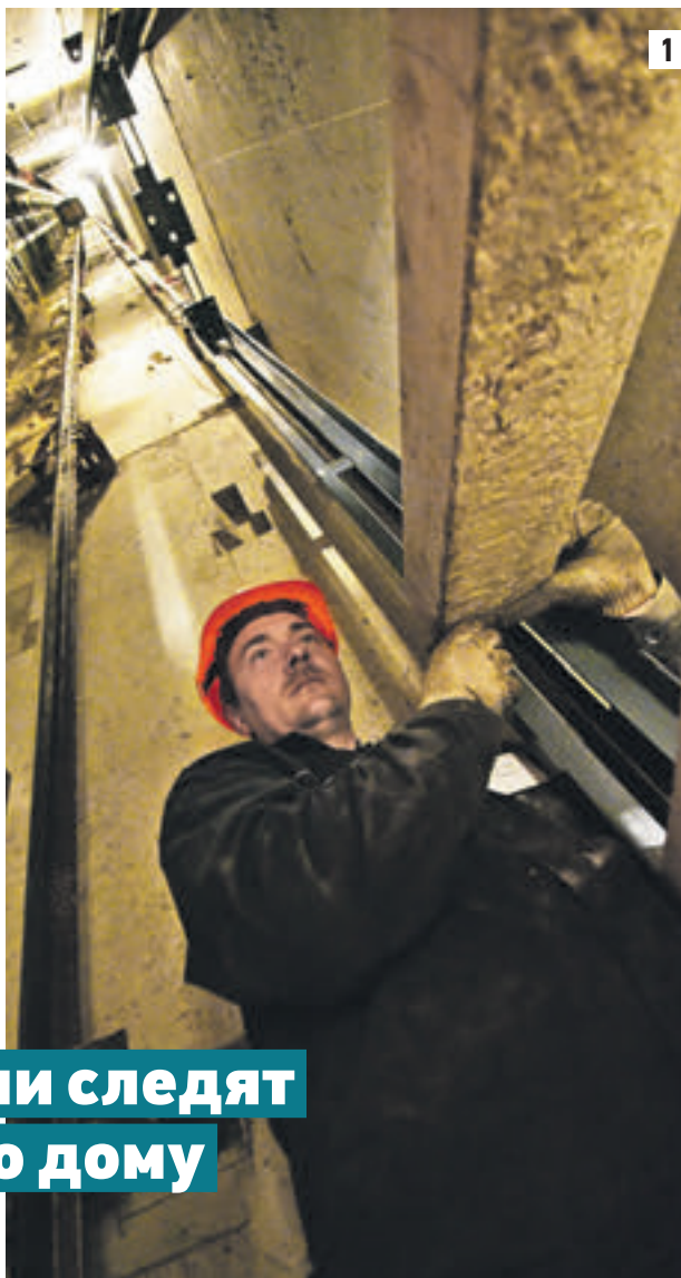
17 августа 2015 года. Работы по замене лифта идут одновременно в шахте и машинном отделении. Всего до конца следующего года предстоит поменять лифты в 1945 жилых домах столицы. Срок работ по каждому лифту — от 45 до 70 дней.

По данным мониторинга жилых домов, который регулярно проводит Мосжилинспекция, в неудовлетворительном состоянии на 2015 год было 22 процента инженерных систем домов. Эти дома и будут ремонтироваться в первую очередь. В основном это так называемые хрущевки, а также старинные здания и дома довоенной постройки.