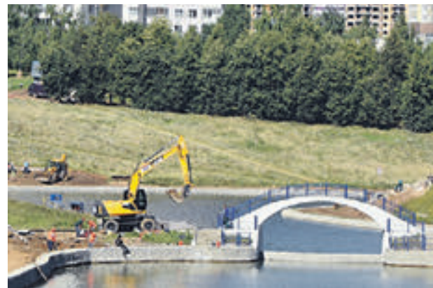
14 августа 2015 года. В парке Олимпийской деревни продолжается комплексное благоустройство

всех. Вообще в городе мы сделали около 400 новых парковых территорий, почти в 3 раза больше, чем было в Москве.