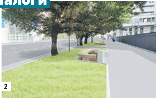
14 августа 2015 года Работы по реконструкции Мытной улицы видны даже в специальном зеркале безопасности для автомобилистов (1) Такой Мытная будет уже в начале сентября, после окончания ремонта в рамках программы «Моя улица» (2)

— Я рад, что это произошло, ведь улица Мытная — историческая, — рассказывает москвовед Владимир Со-