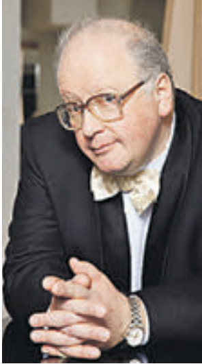
7 августа 2015 года. Телеведущий Павел Любимцев

это государство называется Словения — меня посадили с поездом вместе с багажом. Для меня это был шок. Но ведь человек в экстремальной ситуации мобилизуется и очень быстро находит выход из сложного положения. Ровно три дня пришлось мыкаться по Словении, зато голова работала замечательно, и английский язык я вспомнил мгновенно. А мои друзья на Апеннингах тем временем какими-то невероятными способами продлевали мне визу. После чего я благополучно продолжил свой путь.