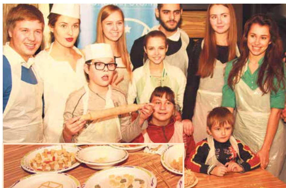
Рисунки из макарон получились разные: кто-то рисовал солнце, а кто-то – дом с цветущим садом