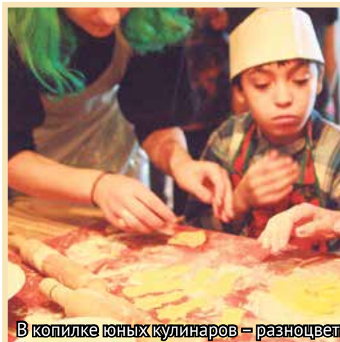
В копилке юных кулинаров – разноцветное печенье

дителей, за большим круглым столом и вспоминать, как прошло лето.