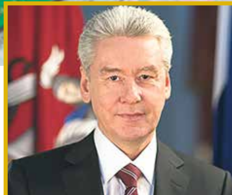
Мэр Москвы Сергей Собянин: