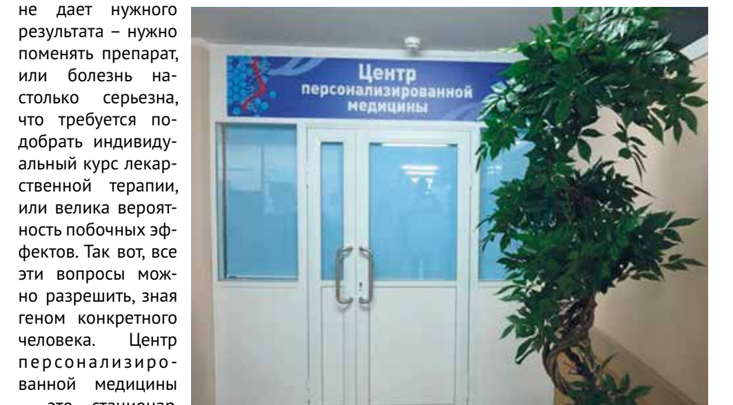
В центре персонализированной медицины на базе ГКБ №23 курс лечения больным подбирают в соответствии с их геномом

Наконец, четвертое направление – хирургия легочно-дыхательной системы, торакальная хирургия. Есть в больнице и свой современный консультативно-диагностический центр. Он позволяет провести различные исследования, в том числе высокотехнологические. Если у вас проблемы со щитовидной железой, в центре проводят комплексное обследование: консультация, УЗИ, проверка на гормоны, биопсия. Раньше, чтобы провести все эти исследования, нужно