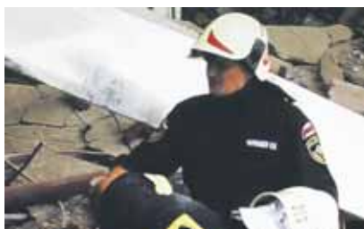
Евгению Чернышеву звание Героя России присвоили посмертно

День для слета выбрали не случайно, это особая, хоть и грустная дата. Дата гибели героя России Евгения Чернышева.