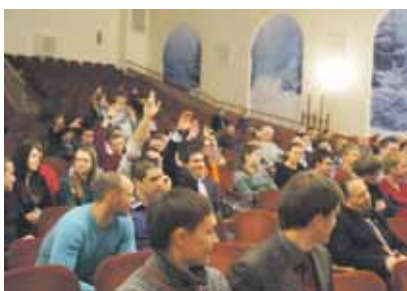
Из 1637 добровольцев 990 – студенты вузов

В отличие от профессиональных пожарных добровольцы в основном участвуют в профилактических мероприятиях. Риска для жизни здесь почти нет. Но на вопрос, кто готов столкнуться с настоящим пожаром, откликнулись многие в зале. Кто эти решительные люди? Из 1637 столичных добровольцев 990 – студенты вузов, то есть молодежь, не утратившая способность сопереживать и понимать необходимость добровольчества. Это люди, победившие вирус эгоизма.