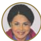
График дебатов будет сформирован до 20 мая и размещен на сайте Москва2014.рф . Там же можно задать вопрос кандидатам.

Члены Оргкомитета уверены, что дебаты позволят москвичам лучше узнать своих кандидатов, а кандидатам дадут дополнительную площадку для представления своей программы.