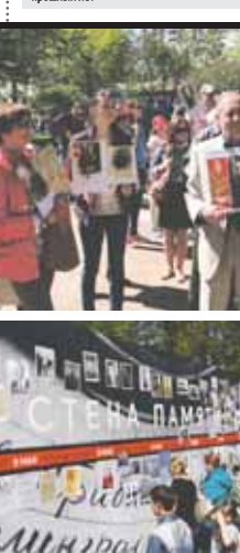
установлен мультимедийный экран, на который также транслируются фотографии участников Великой Отечественной войны.