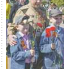
Будущие защитники общались с героями прошлых лет