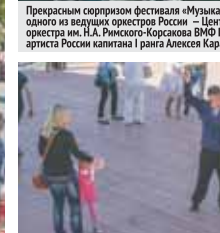
Кружась в танце под музыку прошлых лет, пары разных поколений уносились в атмосферу 40-х годов прошлого века