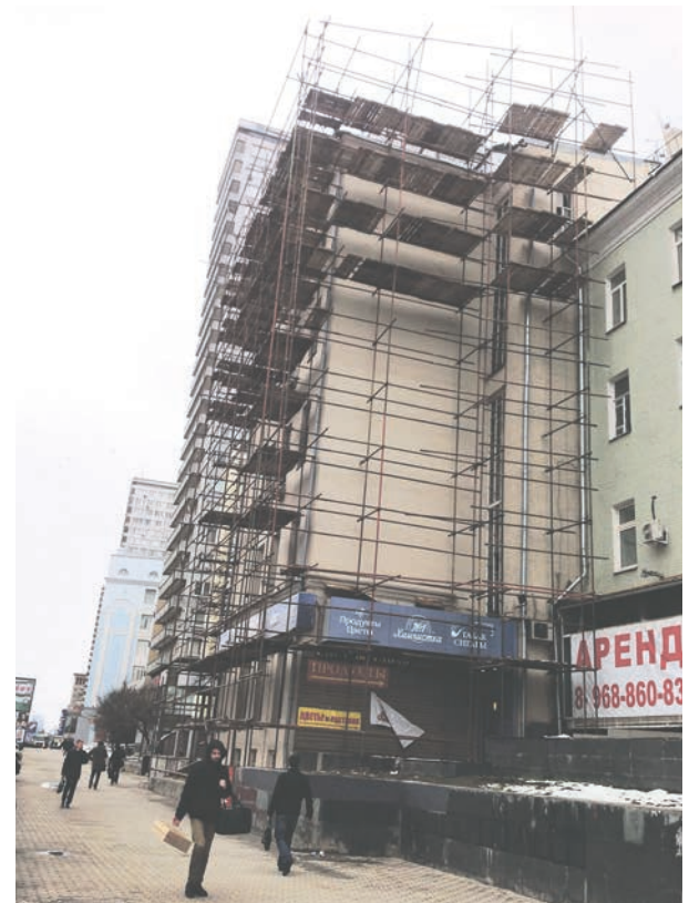
Строительные леса разобрали 11 мая. Дальнейшую судьбу чердака решит суд

Префектура ЦАО приняла решение о разборке строительных лесов, запросе дополнительной технической документации и направлении материалов в правоохранительные органы. Проблема надстройки этажей в жилых домах является наиболее острой в районе Арбат, бороться с которой у представителей окружных и городских структур нет полномочий без соответствующего решения суда.