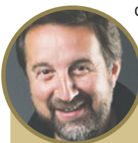
Член Федерального гражданского комитета «Гражданская платформа» актер ЛЕОНИД ЯРМОЛЬНИК :

Ярмольник стал первым кандидатом, выдвинутым «Гражданской платформой», и одним из последних зарегистрировавшихся на выборах в Мосгордуму. Напомним, регистрация закончилась 15 мая. Предварительное голосование перед выборами в Мосгордуму планируется провести 8 июня. Оно пройдет на 500 избирательных участках, специально организованных для праймериз.