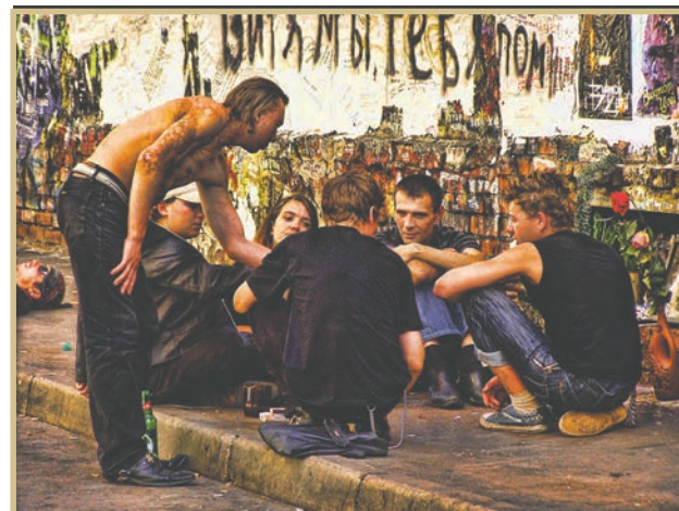
Эти люди не были похожими на настоящих фанатов, хотя и называли себя таковыми. Они кланчили у прохожих деньги якобы на поддержание стены в порядке, продавали им краску, предлагая оставить свою надпись, и тут же пропивали вырученные деньги под аккомпанемент пьяной гитары. Тут же гадили и спали.

В своем большинстве новые надписи отношения к Цою не имели, а некоторые так и вовсе носили оскорбительный характер в адрес главы государства. Разумеется, последние были оперативно закрашены управой района. Однако избавиться от множества маргинальных личностей, посещавших культовое место в самом одурманенном состоянии и буквально живших здесь же на тротуаре, стена Цоя не смогла.