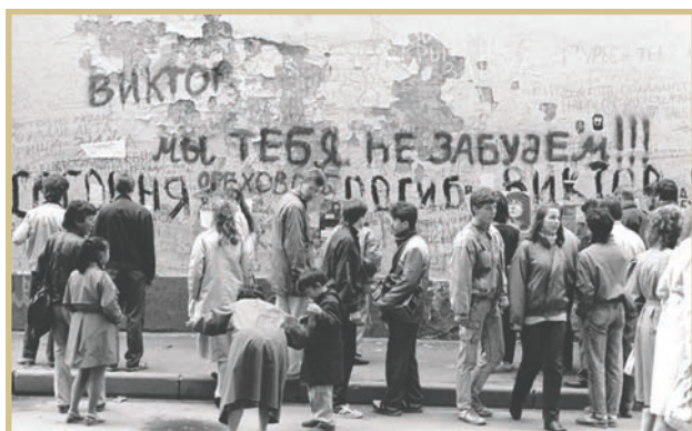
Трагическая смерть Виктора Цоя 15 июля 1990 года стала для фанатов настоящим шоком, и стена городской усадьбы XVIII века, у военного трибунала, закрытого на долгую реставрацию, стала стеной Виктора Цоя на Арбате.

Группа «Кино» в конце 80-х находилась на пике популярности, а сам Цой переехал в Москву. Тогда же на стене появился портрет музыканта, а среди его поклонников ходила легенда, что именно у этой стены питерский рокер пел жившей в доме №35 любимой девушке серенаду «Восьмиклассница». Эта песня благодаря своей простоте стала культовой для нескольких поколений уличных музыкантов, обитавших на Арбате. Разумеется, среди них ходили слухи, что и сам Виктор часто бывает у своей возлюбленной. В день рождения Виктора Цоя здесь собирались сотни его поклонников, оставлявших на стене послания кумиру. Трагическая смерть Цоя 15 июля 1990 года стала для них настоящим шоком, и стена городской усадьбы XVIII века, у военного трибунала, закрытого на долгую реставрацию, стала стеной Виктора Цоя на Арбате.