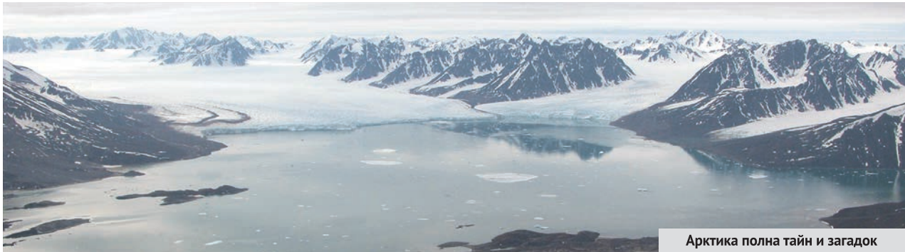
Арктика полна тайн и загадок

вод в русло реки. «Ведь перегороженная подземная речка, заполняя грунтовые толщи и не имея свободного выхода к основной реке, может породить ту самую флюидную активность, что наблюдается у вулканов, – уверен Леонид Собисевич. – Так что накопленный нами опыт вполне может пригодиться проектировщикам для того, чтобы не породить «искусственные вулканы» в самом центре столицы».