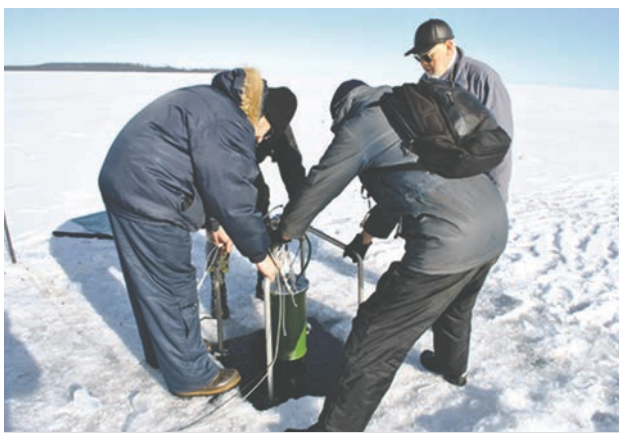
Экспедиционные работы на льду