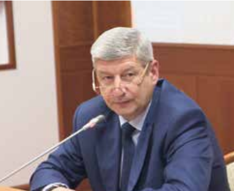
Глава Департамента градостроительной политики Сергей Левкин:

По словам Сергея Левкина, сегодня в центре реализуются принципы, заложенные мэром Москвы Сергеем Собяниным в самом начале его работы: разгружать центр от офисного пространства и насыщать ЦАО объектами социального и культурного значения. Надо отметить, что в целом внешний облик центра столицы заметно меняется: реконструируются улицы и фасады зданий, благоустраиваются скверы и парки.