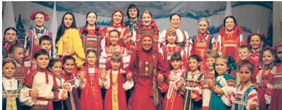
Детская песенно-танцевальная студия «Наследие» празднует в этом году свое 12-летие. Стать ее участниками могут дети от 2 до 15 лет.

– В современном обществе мало внимания уделяется сохранению культурного наследия и наших традиций. Позабыли о необходимости заботиться о пожилых людях. Сейчас все поставлено на коммерциализацию. Страдают от этого в первую очередь люди социально не защищенные. Мы создали программы, благодаря которым возможно повысить уровень культуры общества и быта среди всех слоев населения. В основном это касается детей и пожилых людей. Нужность этих социальных программ и предложений по поправкам в законодательство я обсудила с жителями как раз во время предвыборной кампании – меня поддержали! Упомяну об одном проекте, адресованном молодому поколению. В ближайшее время на базе столичных школ заработают досуговые детские песенно-танцевальные студии «Наследие». Вообще, студия «Наследие» существует уже 12 лет при театре «Русская песня» на Садовой-Черногрязской, д. 5/14. Здесь дети занимаются в двух возрастных группах: в группе «Мать и дитя» дети от двух до четырех лет занимаются вместе с мамами, во вторую группу входят дети постарше – от пяти до 16 лет. Кстати, в этом году с открытием нового здания театра на Олимпийском проспекте, 14, старое здание было решено