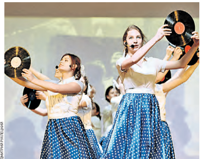
24 апреля, 14:15 Торжественный концерт в столичной школе № 480, носящей имя Виктора Талалихина