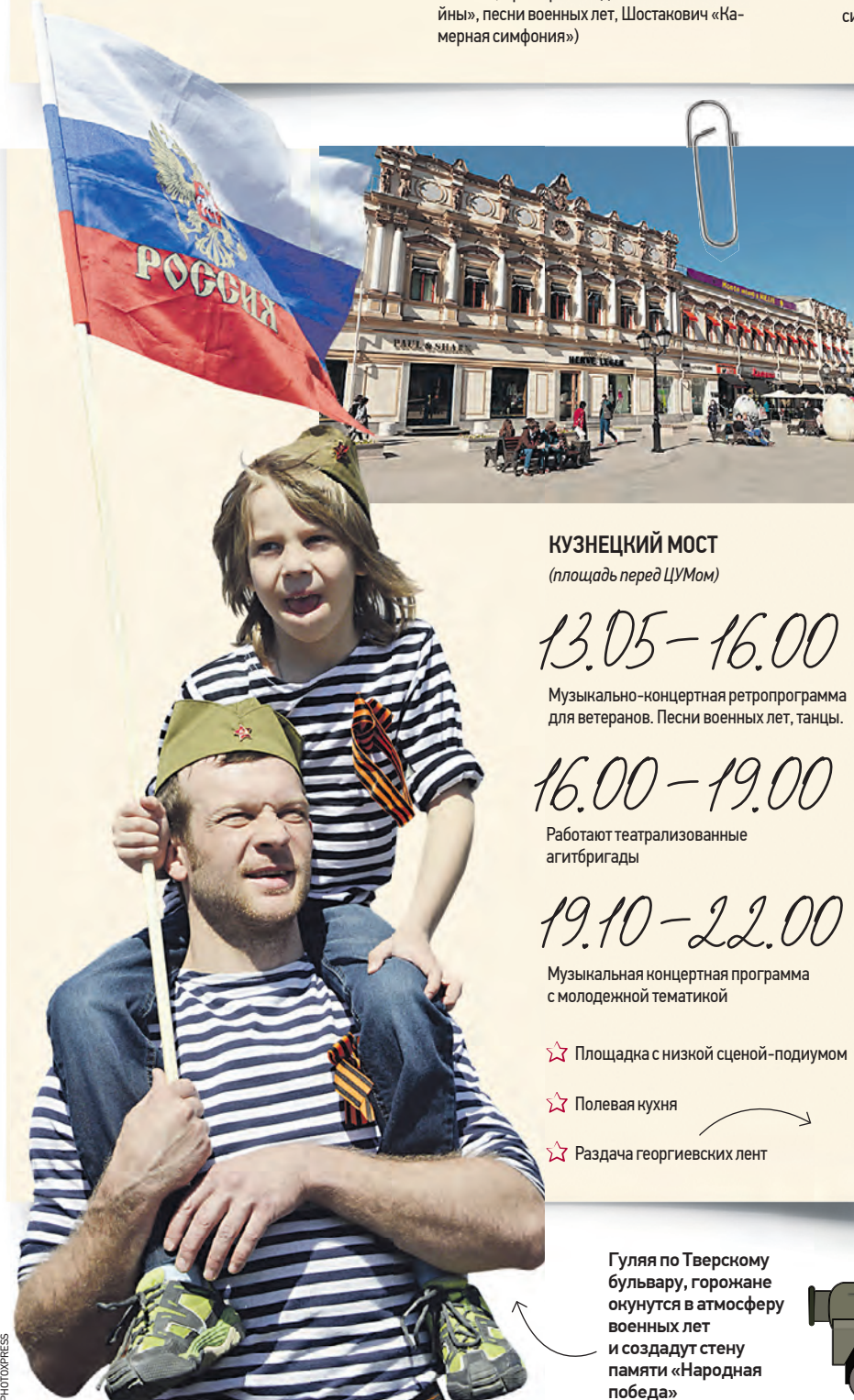
КУЗНЕЦКИЙ МОСТ (площадь перед ЦУМом)

Как всегда, яркое музыкальное сопровождение всем участникам праздничного парада Победы на Красной площади обеспечит Центральный военный оркестр Министерства обороны России