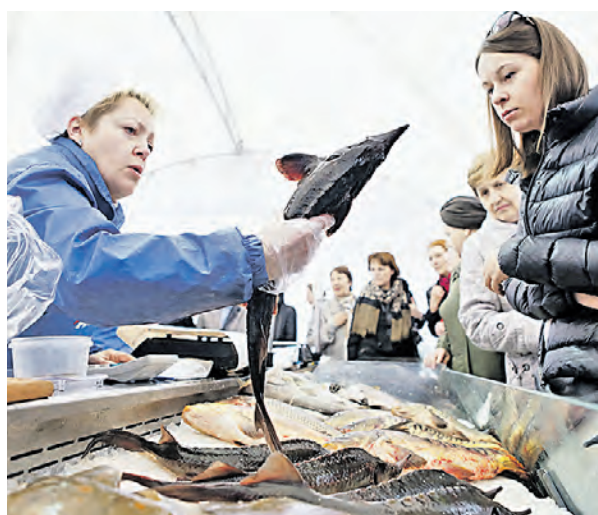
27 апреля 2015 года 13:25 Рыбный фестиваль. Ярмарка на Кузнецком Мосту

— В покупке москвича преобладают, наряду с карпом, который занимает первое место по продажам, такие виды рыбы, как дорадо, сибас и семга. Нам хотелось бы вот этой акцией популяризировать больше именно русские сорта, коих в России вылавливается более 200, и показать на фестивале, что из них действительно можно сделать что-то вкусное и интересное.