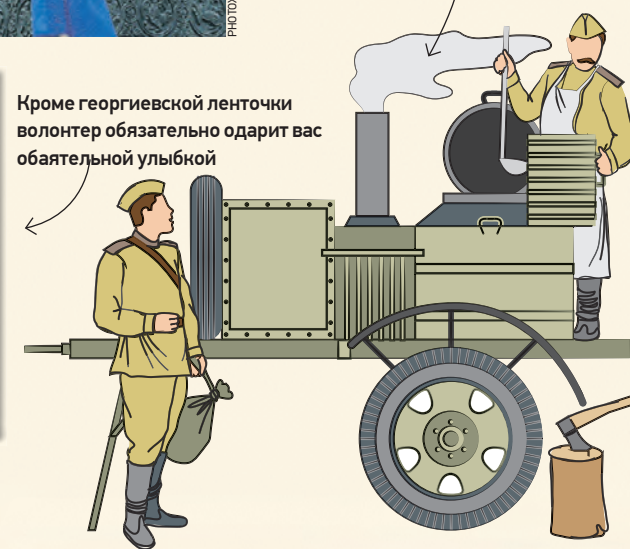
Кроме георгиевской ленточки волонтер обязательно одарит вас обаятельной улыбкой