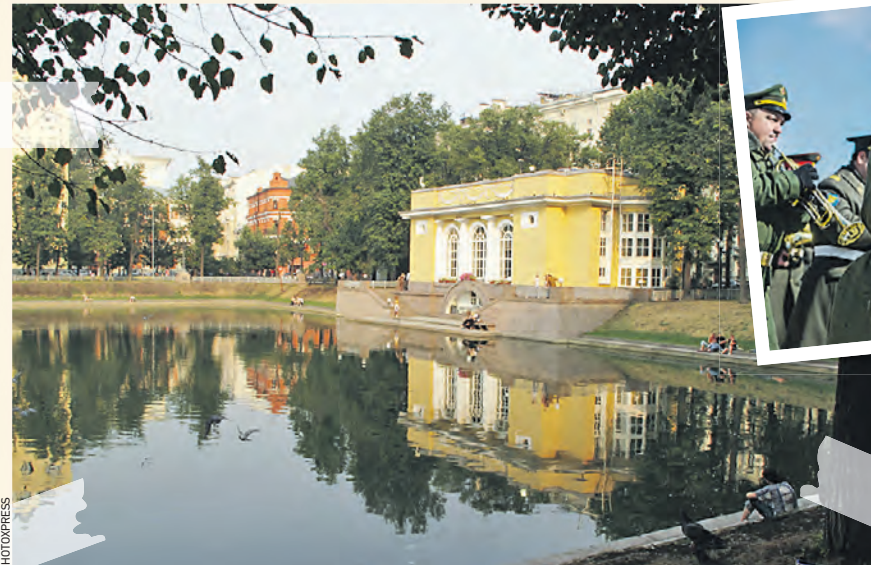
ПАТРИАРШИЕ ПРУДЫ — «МУЗЫКА НА ВОДЕ»

Центр столицы украсят выставки: «Москва военная», Арбат, «Афиши кино военных лет», Пушкинский сквер