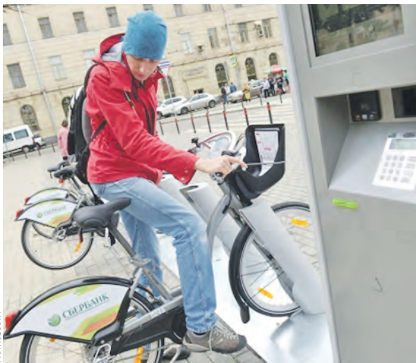
26 апреля 11:40 Чистопрудный бульвар. Оплатить парковку велосипеда и автомобиля можно в одном терминале

стопрудном и Покровском бульварах, на Тверской, у Сретенских ворот, на Фрунзенской набережной — всего 25 адресов, уточнить которые можно на сайте московского парковочного пространства — parking.mos.ru. Проверяю сервис на себе. Паркую машину на Гоголевском бульваре. Велотерминал недалеко от станции метро «Кропоткинская». Велотерминал принимает пластиковую карту — теперь в электронном меню надо выбрать пункт «Оплата парковки». Прочие действия — как при использовании паркомата — номер авто, номер парковочной зоны, оплачиваемое время стоянки... Ну, пусть будет один час. Нажимаю «Подтвердить» — тут же приходит sms с уведомлением о снятии со счета карты 80 рублей. Достаточно удобно. Правда, я был единственным, кто оплатил парковку через велотерминал в этом месте. Возможно, водители еще не узнали об этой новой услуге.