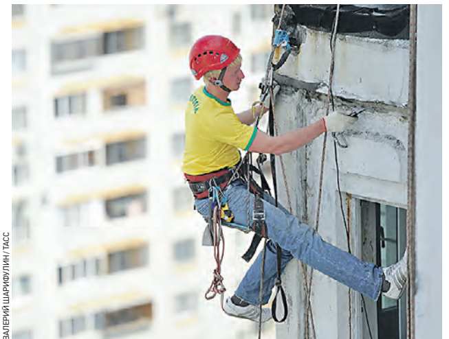
15 апреля 2015 год. Промышленный альпинист выполняет работу на жилом доме по Краснохолмской набережной

По итогам информационных встреч с главами управ районов определенное количество домов склоняется к выбору спецсчета. То есть они сами решат, кто будет управлять их деньгами и вести счет в банке, самостоятельно нанимать подрядчиков, контролировать ход работ и принимать их результат. Это нормально, но в случае выбора спецсчета каждому дому нужны гарантии оплаты со стороны всех собственников. Но заплатят ли все собственники, особенно когда речь идет об организациях-владельцах помещений? Все остальное можно еще изучать и дорабатывать, но эту тему нужно понимать сразу. Однако переходить от спецсчета к региональному оператору, если возникнут сложности со сбором средств, можно будет без проблем.