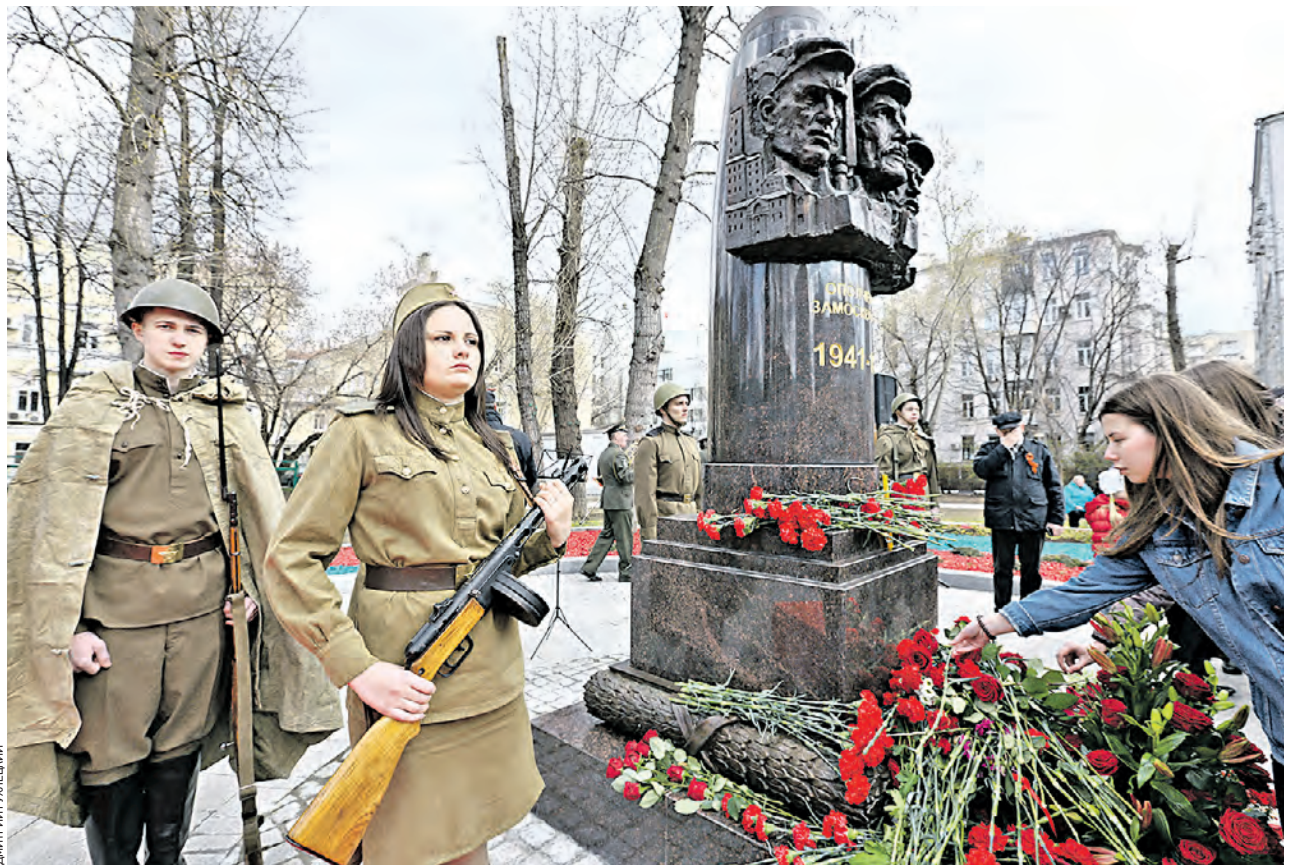
24 апреля, 15:45 Новокузнецкая улица. Возле открытого памятника ополченцам Замоскворечья — почетный караул. И даже после завершения торжественной церемонии горожане продолжали возлагать к монументу цветы

После минуты молчания в память о погибших было объявлено об официальном открытии памятника. — Открытие памятника погибшим ополченцам Замоскворечья — знаковое событие для округа в преддверии 70-летнего юбилея Великой Победы, — заявил префект