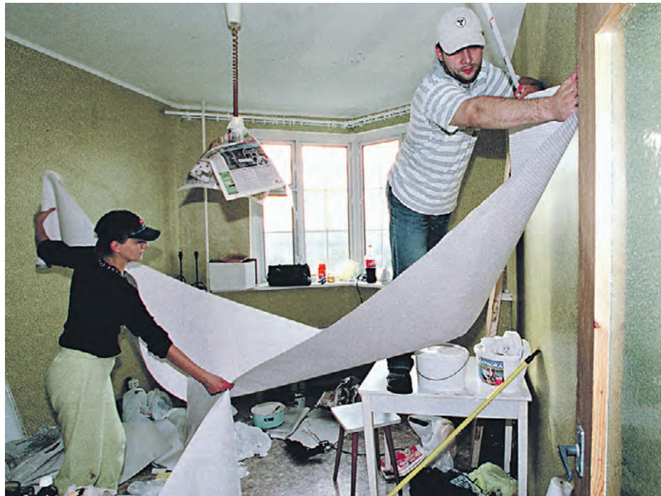
16 марта 2015 года. Москва. Лаврушинский переулок, дом № 11, ремонт в квартире

Очень активно информационная компания прошла в Красносельском районе — ведь здесь много старых домов, нужно четко себе представлять: смогут ли жители самостоятельно накопить средства на ремонт. Для тех, кто еще не в курсе: теперь капитальный ремонт жилья будет проводиться за счет собственников, поэтому необходимо выбрать регионального оператора или соз-