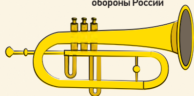
Площадка со специальной водной сценой и оборудованная для зрителей сиденьями на берегах

18.00–19.00 Концертная программа «Песни военных лет» 19.30–21.00 Программа классической музыки (ансамбль солистов исполняет сочинение Уствольской Dies irae, Прокофьев «Ода на окончание войны», песни военных лет, Шостакович «Камерная симфония»)