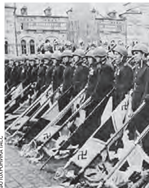
24 июня 1945 года Победный парад на Красной площади

30 апреля около полудня Гитлер пообедал со своими секретаршами и кухаркой и ушел к себе. Потом приказал проверить яд на своей овчарке. Собака умерла, минуту спустя зашел Гитлер и посмотрел на труп собаки. Спустя несколько минут адъютант Гитлера штурмбаннфюрер Отто Гюнше сообщил, что фюрер мертв, и попросил двести литров бензина. Как известно, вместе с Гитлером умерла и Ева Браун.