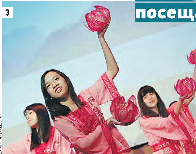
24 апреля 2015 года 13:30 Посол Вьетнама в России Нгуен Тхань Шон (1–2) Ансамбль «Колокольчик» лицея № 1500 (3)

Столичные педагоги ежегодно посещают Ханой