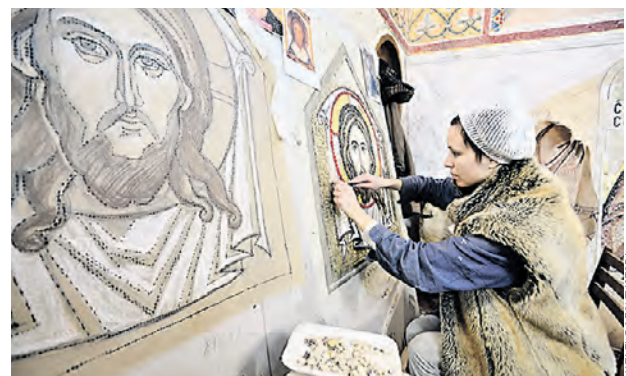
Реставрация храма Покрова Пресвятой Богородицы в Ясеневе

Москвичи могут выдвинуть идеи для названия новой программы, без упоминания конкретных цифр. С подобной инициативой выступил Патриарх Московский и всея Руси Кирилл. По его словам, люди