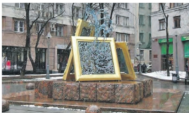
16 февраля 2015 года. Лаврушинский переулок. «Фонтан искусств», открытый к 150-летию Третьяковской галереи

можно угадать полотна «Царь Иван Грозный» Виктора Васнецова, «Снедь московская. Хлебы» Ильи Машкова и «Березовая роща» Архипа Куинджи. Фонтан имеет еще второе название — «Вдохновение». Не менее необычным можно назвать и фонтан «Похищение Европы», открытый 13 лет назад на площади Киевского вокзала. Теперь это площадь Европы. Приходите сюда вечером — фонтан удивительно подсвечен.