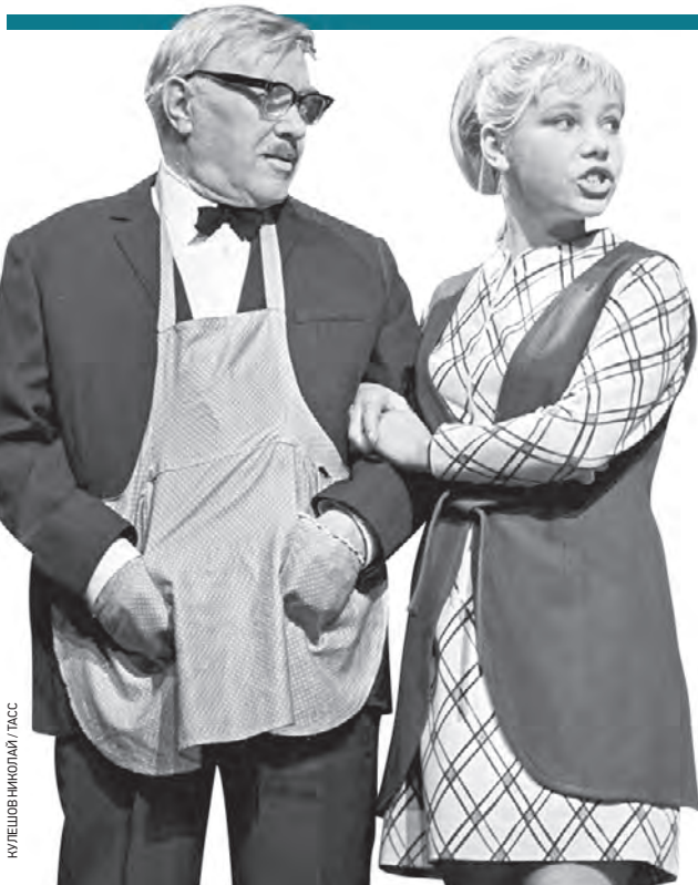
КУРЕШОВ НИКОЛАЙ / ТАСС