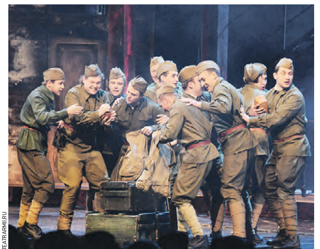
Сцена из спектакля Театра Российской армии «Судьба одного дома». Постановка посвящается 70-летию Победы

7/V Олег Погудин. «Песни Великой войны». 8/V «Марш победителей». Президентский оркестр РФ. 9/V Ансамбль «Благовест». В. А. Моцарт «Реквием». «Любимые мелодии и песни военных лет». Праздничный концерт. Академический оркестр русских народных инструментов им. Н. Н. Некрасова.