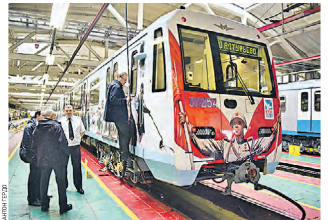
20 апреля 2014 года Поезд «70 лет Великой Победы» теперь обслуживает пассажиров Серпуховско-Тимирязевской линии

На Серпуховско-Тимирязевской («серой») линии столичного метрополитена начал курсировать именной поезд «70 лет Великой Победы».