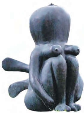
Памятник девушке-стрекозе. Установлен в 2007 году на улице Воронцово Поле

Животным памятники ставят нередко, насекомым — гораздо реже. В Москве, правда не в центре, а в Кузьминках, есть мемориал пчеле Кузе. А вот в немецком селе Вюрхвиц, где производят сыр, есть памятник... клещу!