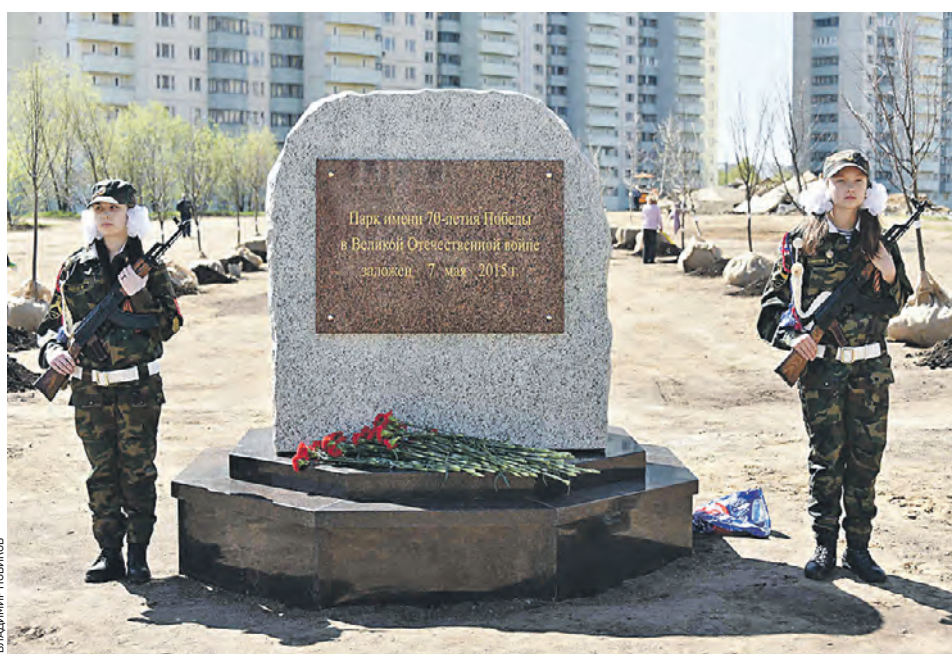
7 мая 2015 года. Около Севастопольского проспекта в районе Новые Черемушки заложен Парк имени 70-летия Победы в Великой Отечественной войне

Территория парка с северной стороны ограничена улицей Болотниковской, с запада — проектируемым проездом № 6083, с юго-востока — проектируемым проездом № 3843. Площадь его в перспективе составит семь с половиной гектаров. Непосредственно к парку в честь 70-летия Победы примыкает территория, отведенная для строительства храма. Напротив находится благоустроенный парк имени полковника Ерастова, что позволяет в перспективе создать единую зеленую территорию. В новом парке планируется провести работы по благоустройству, включая создание дорожно-тропиночной сети, спортивной и детской площадок, зо-