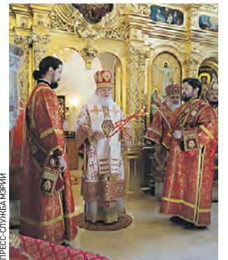
8 мая 2015 года. Освящение храма Преображения Господня

После богослужения глава Русской православной церкви вручил супруге председателя правительства РФ Светлане Медведевой орден Святой равноапостольной княгини Ольги. А мэр Москвы Сергей Собянин был удостоен Патриаршего знака храмостроителя за участие в восстановлении православных храмов столицы. Затем собравшиеся возложи-