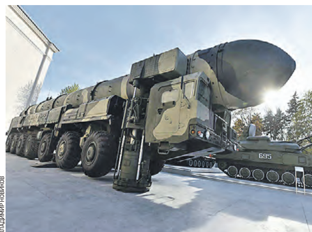
7 мая 2015 года. На Выставке достижений народного хозяйства теперь можно будет увидеть даже ракетный комплекс «Тополь»

установка «Шилка», боевые машины зенитного ракетного комплекса «Оса-АКМ» и зенитной ракетной системы «Тор», самоходная огневая установка зенитного ракетного комплекса «Бук», станция наведения ракет и пусковая установка зенитной ракетной системы С-300, пусковая установка подвижного грунтового ракетного комплекса «Тополь», зенитная самоходная установка «Тунгуска», а также мобильная радиолокационная станция наземной артиллерийской разведки СНАР-10 1РЛ232.