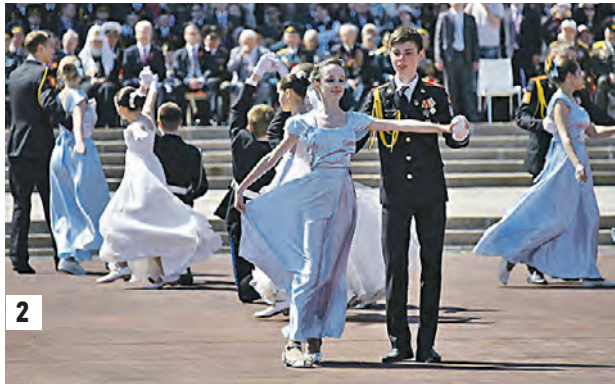
6 мая 2015 года. 1 Первый московский парад кадетов на Поклонной горе 2 Любимый кадет обязан уметь танцевать

У колоннады Музея Великой Отечественной войны собрались тысячи человек: военные в парадных мундирах, школьники, представители московского казачества. Колонны ребят в одинаковой форме: синие рубашки с нашивками, черные брюки и юбки, разноцветные галстуки пионерского стиля — это «Братство православных следопытов». На противоположной стороне площади, на трибунах расположились ветераны и гости. «Принимали» шествие глава РПЦ патриарх