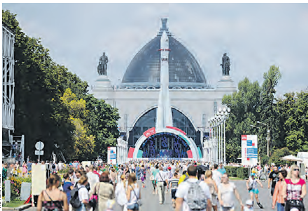
В павильоне «Космос» откроется Музей космонавтики, темы которого определялись в проекте «Активный гражданин»

Наибольшее число голосов было отдано трем из них: современные достижения авиации и космонавтики, история, интерактивные модули.