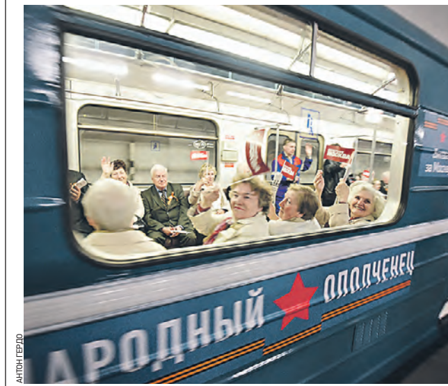
7 мая 2015 года. Обновленный поезд «Народный ополченец» отправился в первый рейс