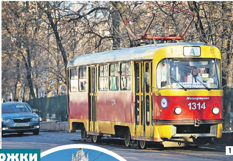
Трамвай «Аннушка» (1) вернется на Бульварное кольцо, а по Садовому кольцу можно будет прокатиться на велосипеде (2)

Проект реконструкции этих важнейших городских магистралей, выиграв конкурс, разработало конструкторское бюро «Стрелка». Сообщение внутри колец будет изменено. Так, Кремлевскую, Софийскую,