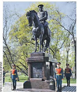
6 мая. Открытие памятника маршалу Рокоссовскому

Коллектив скульпторов под руководством Александра Рукавишникова в бронзовом монументе изобразил военачальника верхом на коне во время легендарного Парада Победы в Москве 24 июня 1945 года. На церемонии открытия нового памятника присутствовали председатель правительства России Дмитрий Медведев и мэр Москвы Сергей Собянин. Российский премьер напомнил, что маршал Рокоссовский