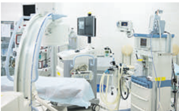
18 августа 2015 года. Новое высокотехнологичное оборудование улучшит качество медицинского обслуживания крымчан

— Мы развернули большую комплексную программу сотрудничества в области образования, социальной сферы, культуры, в части поставок коммунальной техники, транспорта. Од-