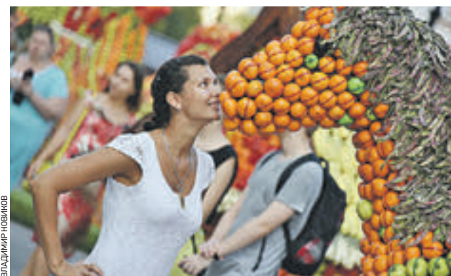
13 августа 2015 года. На Манежной площади гостей Фестиваля варенья встречала вот такая симпатичная фруктовая лошадь

столицы, в частности, на Манежной площади, украшенной 11-метровым шаром-арбузом, на Тверской и Театральной площадях, Камергерском и Климентовском переулках, Новоушиновском сквере и площади Революции. В масштабном празднике, уже ставшем визитной карточкой города, участвовали представители 40 регионов России и 19 зарубежных стран.