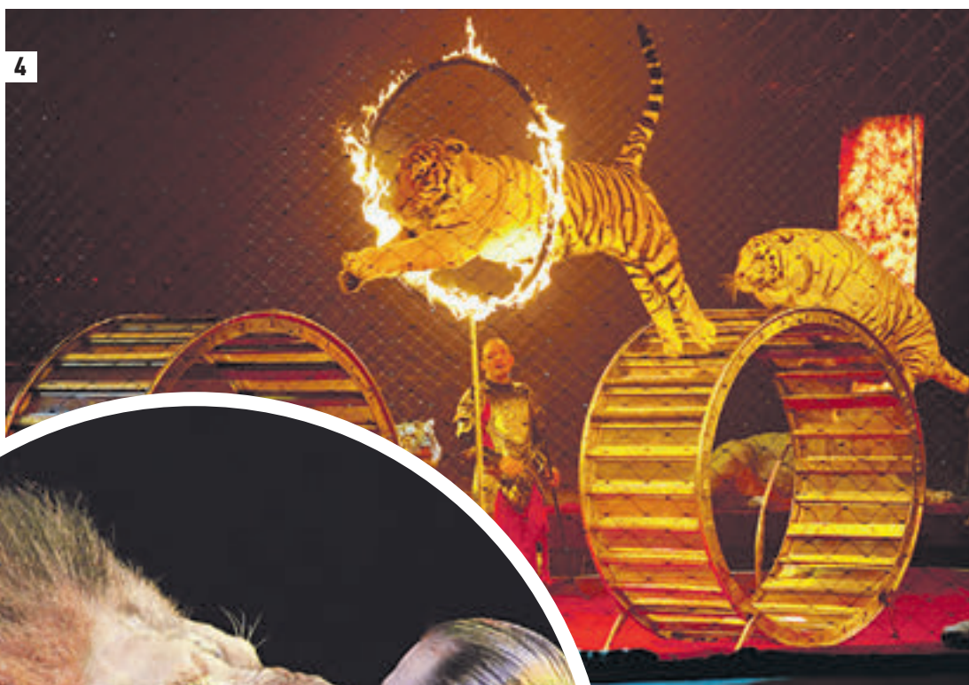
Укротитель тигров Аскольд Запашный (1) во время выступления может легко стать жонглером. Как и его брат Эдгард (слева) (2) Эпизод новой программы цирка на проспекте Вернадского (3, 6) Фрагмент шоу «Камелот-2. Наместник богов» (4) Поцелуй со львом на аттракционе «Среди хищников» (5)

Все желающие смогут с 1 по 6 сентября побывать на экскурсии и узнать о строительстве нового парка «Зарядье»