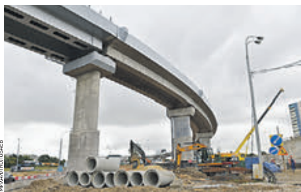
17 августа 2015 года. Первый из направленных съездов новой развязки уже практически готов к открытию движения

— Работы выполнены уже на 80 процентов. Надеюсь, что в ноябре развязка будет запущена, — сказал Сергей Собянин. Напомним, что суть реконструкции — отказ от устаревшей «клеверной» схемы съездов, спроектированных 60 лет назад. Реконструиро-