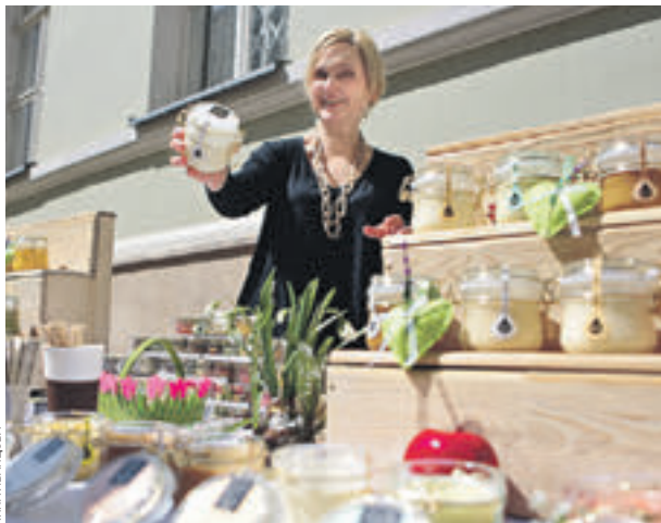
Июль 2014 года. Первая гастрономическая улица в столице

Гастрономическая реконструкция ждет на всех площадках. К примеру, вблизи Триумфальных ворот князя Меншикова будут угощения и закуски начала XVIII века. В их числе просяное пирожное, изготовленное из крутой пшеничной ка-