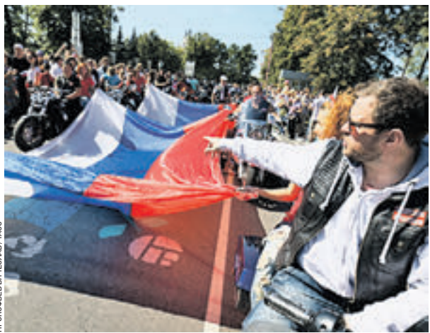
22 августа 2015 года. Праздничные мероприятия по случаю Дня государственного флага России