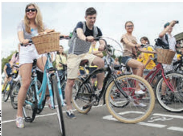
Июнь 2013 года. II Московский велопарад. В нем приняли участие 7 тысяч человек. В нынешнем году ожидается в три раза больше

Этот велопробег организован в поддержку развития велосипедной инфраструктуры и призван повысить безопасность на дорогах. Проводится Департаментом транспорта и развития дорожно-транс-