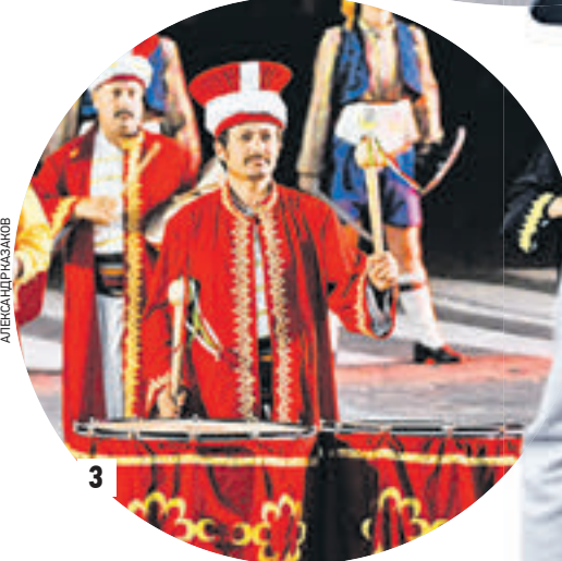
Самым заметным событием Дня города станет фейерверк (1), на Неглинной пройдет Фестиваль театров (2), по Тверской прошедут оркестры «Спасской башни» (3), а на Пушкинской — Фестиваль прессы (4)