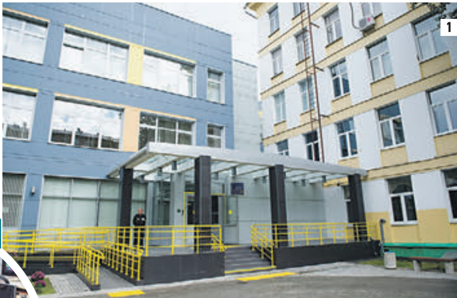
20 августа 2015 года. Новое здание гимназии №1514 (1) обрадует учеников 1 сентября. А в классах их ждет самое современное компьютерное оборудование (2)

залы, хорошая библиотека, медицинский центр, медиатека. Гимназия оснащена всем необходимым современным оборудованием. — Я надеюсь, здесь будет комфортно учиться, — отметил мэр Москвы Сергей Собянин, посетив гимназию 20 августа. — Школа такая серьезная, одна из лучших в городе и одна из лучших, наверное, в стра-