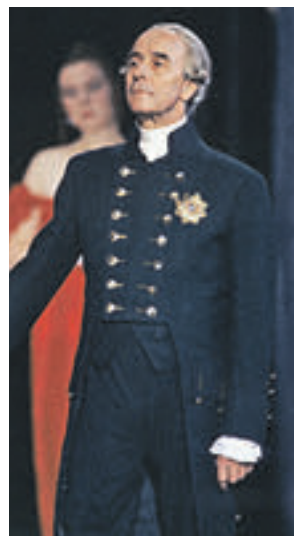
Олег Борисов в роли Павла Первого (фото 1989 года)