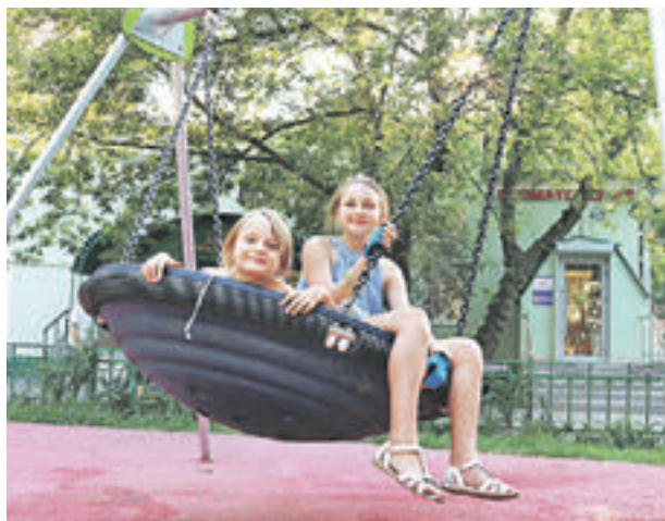
11 августа 2015 года. Девочка обожает таблетку — оригинальные качели во дворе дома № 13 по Голицыновскому переулку

Ваш двор тоже может стать героем нашей рубрики. У вас во дворе красивая клумба? Вы устраиваете во дворе посиделки с соседями? Пишите на okrug@vm.ru или на (929) 996-49-79.