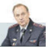
Александр Букач начальник Управления внутренних дел ЦАО