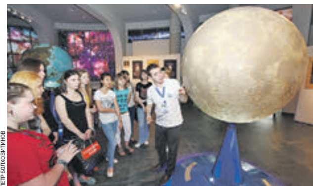
17 мая 2014 года. Планетарий. Учащиеся школ изучают Луну. Пока по глобусу

Зачисление на первый курс астрономического кружка проводится для школьников 5–7-х классов и происходит по результатам собеседований, которые начнутся в сентябре. Занятия будут проходить раз в неделю с начала октября и до конца мая. Курс включает 29 занятий продолжительностью 2 академических часа. Уже на первом курсе ребята узнают об истории астрономии, происхождении Солнечной системы, законах движения небесных тел, а научившись работать с различными типами телескопов, самостоятельно проведут наблюдения планеты, Луны, звезд.