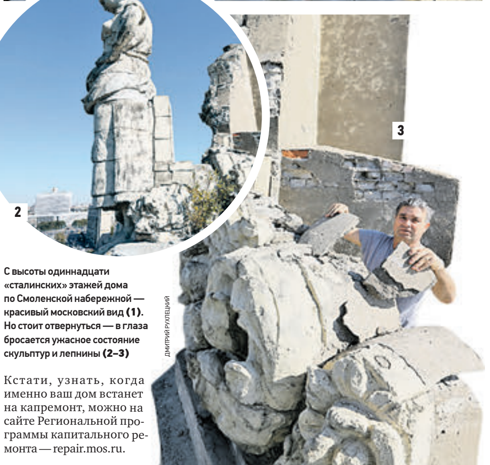
С высоты одиннадцати «сталинских» этажей дома по Смоленской набережной — красивый московский вид (1). Но стоит отвернуться — в глаза бросается ужасное состояние скульптур и лепнины (2-3)