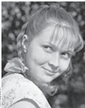
Наталья Гундарева. Кадр из фильма «Сладкая женщина»