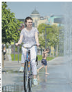
10 августа 2015 года. В жаркие дни лета от фонтанов веяло спасительной прохладой

Делать прогнозы — штука неблагодарная: угадешь — примут как должное, ошибешься — на смех поднимут. Наверное, именно потому и столь велик разброс прогнозов. Больше всего хотелось бы верить в обещанный Гисметео жаркий сентябрь — бюро предсказывает до +30 чуть ли не до октября. Но — мы же реалисты, а потому прогноз от Гидрометцентра — средняя дневная температура +11 (до +18 днем и +6–7 градусов в ночные часы) более реалистичен. Но все лучше, чем сентябрь 1993 года — со средней температурой +6,9 градуса. А будет ли бабье лето — узнаем через неделю, когда прогнозы обновятся.