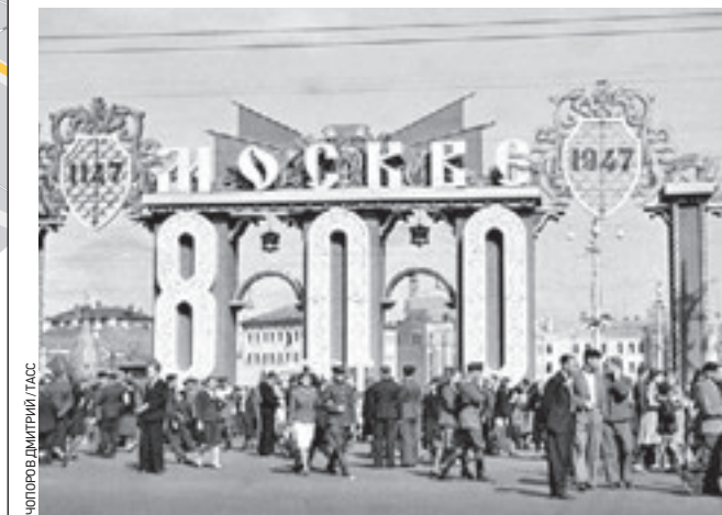
1 сентября 1947 года. Праздничное убранство Пушкинской площади накануне 800-летия Москвы

то памятное историческое событие, чаще всего военному, и дата из-за этого постоянно менялась, не было четкого дня, как сейчас.