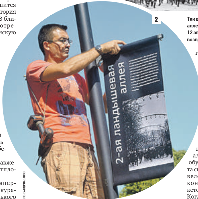
Так выглядела Ландышевая аллея после войны, 1947 год (1) 12 августа 11:50 Аллеям парка возвращают имена (2)