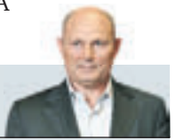
Геннадий Малахов телеведущий, писатель