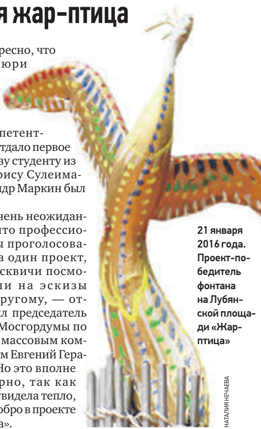
21 января 2016 года. Проект-победитель фонтана на Лубянской площади «Жар-птица»

— Очень неожиданно, что профессионалы проголосовали за один проект, а москвичи посмотрели на эскизы по-другому, — отметил председатель комиссии Мосгордумы по культуре и массовым коммуникациям Евгений Герасимов. — Но это вполне закономерно, так как молодежь увидела тепло, красоту и добро в проекте «Жар-птица».