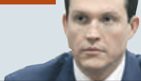
Владимир Гвердовский префект ЦАО

Снег с улиц вывозится на мобильные снегосплавильные пункты. В округе работает 5 стационарных и 24 мобильных установки. Каждая из них может переработать около 2,5 тысячи кубометров снега в сутки.