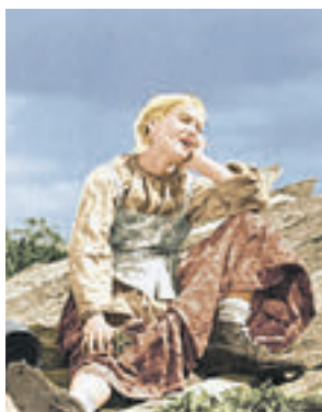
1934 год. Актриса Любовь Орлова в комедии «Веселые ребята»

прыгнуть на спину быка. Утесов отказался. Вызвалась Орлова. Ее посадили на спину зверя лицом к хвосту и отпустили. Любовь Петровна была быка венником по спине, а он метался по съемочному павильону. Наконец актриса рухнула вниз, ее отвезли в больницу с переломом ключицы. «Я влюбилась в Александрова, как кошка, — потом признавалась звезда, — и испугалась, уже сидя на бычьей туше».