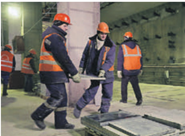
18 января 2016 года. На платформе «Ломоносовского проспекта» уже идут отделочные работы и монтаж различных коммуникаций

Об этом заявил мэр Москвы Сергей Собянин, посетив уникальную в своем роде строительную площадку: ведь для того чтобы построить открытым способом платформу новой станции, пришлось перекрыть движение по Мичуринскому