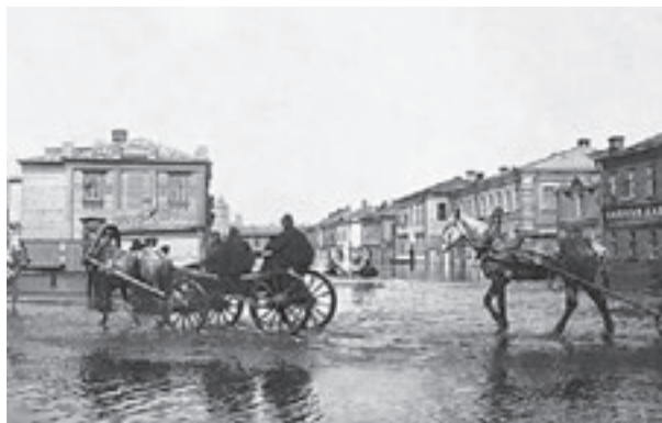
Апрель, 1908 год. Бабьегородский переулок на Якиманке во время наводнения

деревянный сруб, окопали его рвом. Конечно же, пришедшие татары захотели захватить небольшое укрепление, да еще и с женщинами. Но бабы были хитрые и смекалистые. Они попросили, чтобы к ним въехали сначала 50 татар. Усыпив бдительность варваров, они недолго думая их убили. После этого крестьянки защищались от татар еще два дня, пока воевода не прислал за ними ночью лодки и не спас. История красивая, но не очень правдоподобная. Однако некоторые историки предполагают, что местность так назвали намного позже, только в XVII–XIX веках. Дело в том, что берег в этом месте был болотистый, топкий, и его приходилось укреплять. Укрепление производилось с помощью свай, которые городили, то есть вбивали подвесным молотом из дерева или чугуна. Этот молот и называли «бабой». Соответственно в момент работы это место представляло собой своеобразный «бабий городок». Так как центральную часть Москвы затапливало часто, ученые предполагают, что этот городок существовал не одно десятилетие. Кстати, до середины XIX века переулок назывался Бабий.