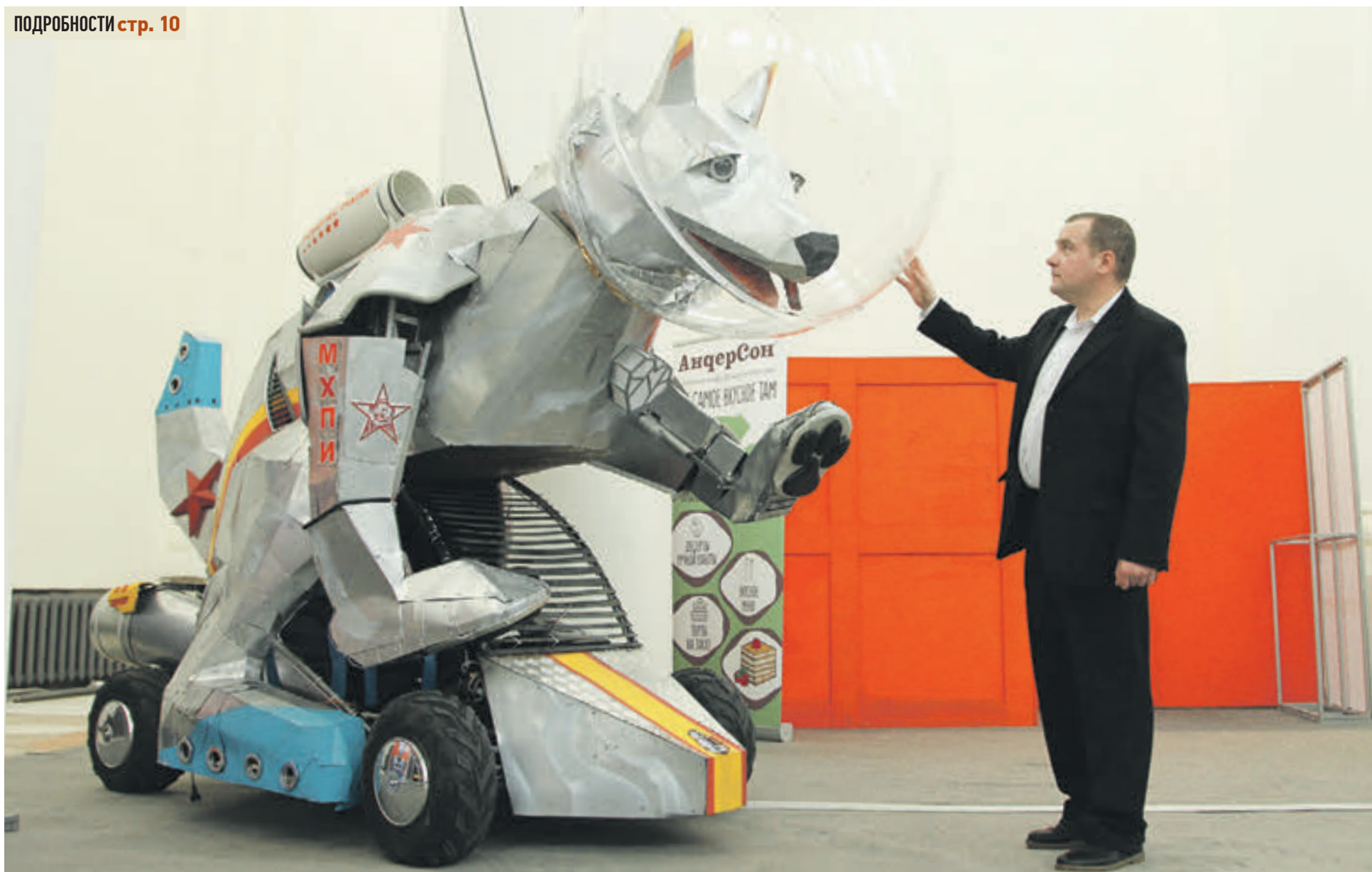
Робот, полностью разработанный и созданный студентами Московского художественно-промышленного института. Дружелюбный звездный гигант весит практически целую тонну и перемещается при помощи специальной платформы, которая называется «Гагаринец»