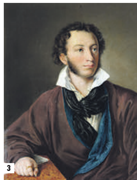
Над «Автопортретом с кистями и палитрой на фоне окна с видом на Кремль» Тропинин работал в 1844 году (1). Портрет А. И. Тропининой, жены художника, был написан в 1809 году. Глаза женщины полны надежды, но вольную семью обретет не скоро... (2). Портрет Пушкина кисти Тропинина (1827 год) был признан самым реалистичным изображением поэта (3). 1823 год. «Кружевница» (4)