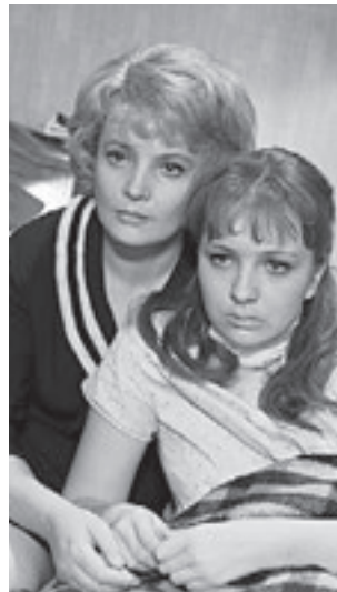
Картину отправили на итальянскую декаду кино