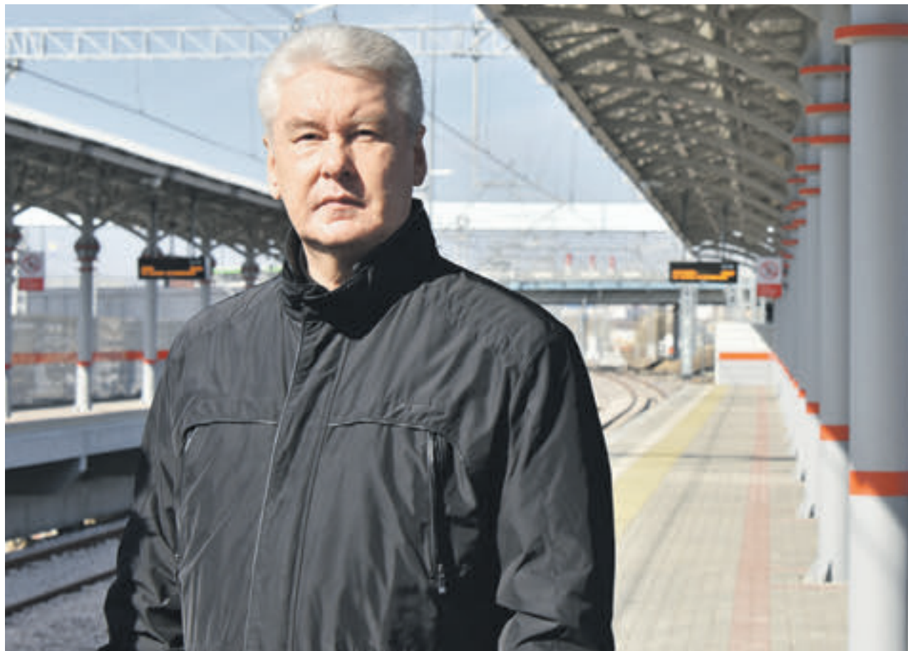
28 марта 2016 года. Мэр Москвы Сергей Собянин ознакомился с ходом работ на Московской кольцевой железной дороге, проехав большую часть 54-километрового пути на новенькой городской электричке, созданной специально для МКЖД

Движение по Московской кольцевой железной дороге запустят 1 сентября этого года