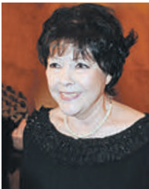
Беллу Ахмадулину выгнали из Литинститута

читала. После этого она работала в газете «Метростроевец», где публиковала не только статьи, но и стихи. А уже в 1956 году она поступила в Литературный институт. Однако в 1959-м Беллу Ахмадулину выгнали из Литинститута за то, что она вступилась за Пастернака: поэта травили за присуждение ему Нобелевской премии, а 22-летняя студентка-филолог за него заступалась. Позднее Беллу Ахмадулину восстановили.