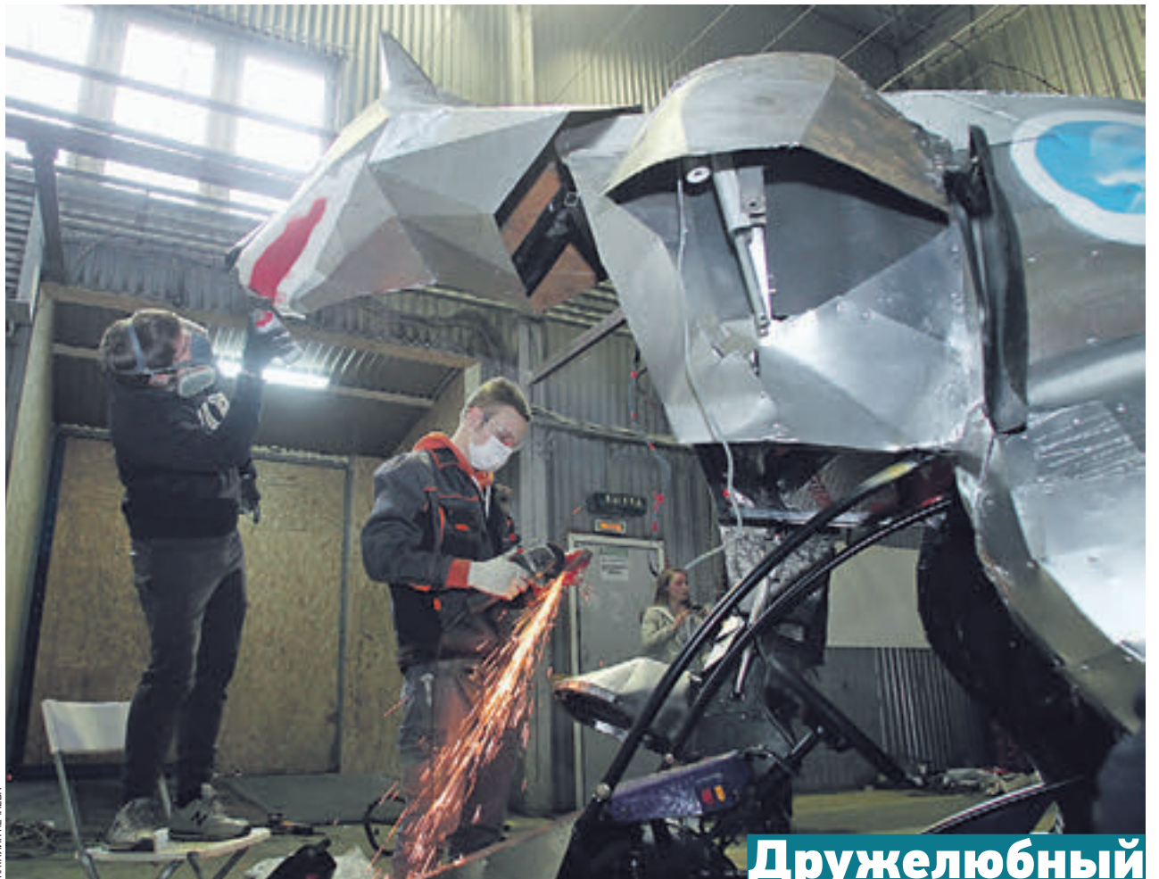
29 марта 2016 года. Студенты МХПИ и МАИ заканчивают работу над металлическим каркасом робособаки. Создание такого гиганта заняло чуть более недели

первыми покорили космические просторы... Наш Сириус в космос не летает, но он — главная звезда в созвездии Большой Пес, откуда и получилось — Звездный пес Сириус.