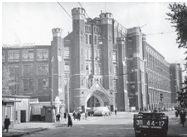
Гражданская война не позволила закончить проект завода, и сооружение появилось здесь только в 1927 году

лись только на фасадной части здания, около главного входа со стороны Венеденской площади. В 90-е годы завод был вынужден сократить производство, перепрофилировать некоторые цеха и совсем оставить другие. Последняя участь постигла и готические здания на Электрозаводской. В конце нулевых они остались практически пустыми и полуразрушенными. Ими заинтересовались частные предприниматели, которым нужны были дешевые склады. Арендаторы заняли чуть ли не половину территории. На сегодняшний день из целого комплекса этих советских предприятий, который когда-то работал над созданием звезд Московского Кремля, функционирует только «Электрозавод». Все остальные помещения в этом замке сдаются в аренду. Оборудование же было перенесено в Зеленоград, где находится территория бывшего завода «Элма». Сейчас в средневеково-индустриальной ратуши завода находятся: киностудия, фотостудия, музыкальная студия, сувенирные и шелкографические производства. Шесть лет тому назад здесь даже была открыта первая художественная мастерская.