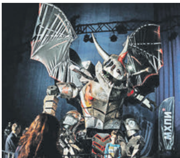
19 февраля 2016 года. Восьмиметрового дракона готовят к международному чемпионату среди боевых роботов

— Жалко, что хвост у нас статичный, — добавляет девушка. — Но мы его обязательно оживим, ведь это — главный способ передачи эмоций для животного.