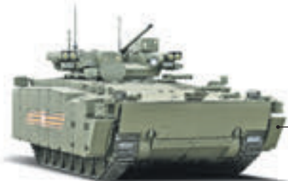
Боевая машина пехоты «Курганец-25»

Создан для ведения боевых действий против любого противника в составе танковых и мотострелковых подразделений