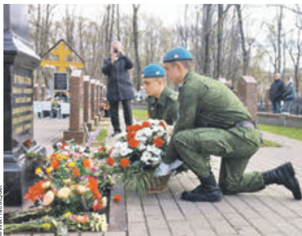
23 апреля 2016 года. На Ваганьковском кладбище привели в порядок воинские захоронения

В субботу, 23 апреля, сотрудники Комитета общественных связей Москвы вместе с ветеранами, кадетами, волонтерами и представителями молодежных организаций отправились наводить порядок на Ва-