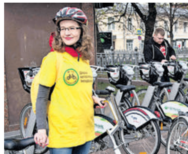
23 апреля 2016 года. Городской велопрокат стремительно расширяется

— Мы запустим этот проект в качестве эксперимента в июле, — сказал Сергей Собянин. — Я надеюсь, что электровелосипеды со временем тоже станут популярными. В этом году мы поставим 150 таких машин. Посмотрим, как они впишутся в городскую среду и насколько это будет комфортно для горожан.