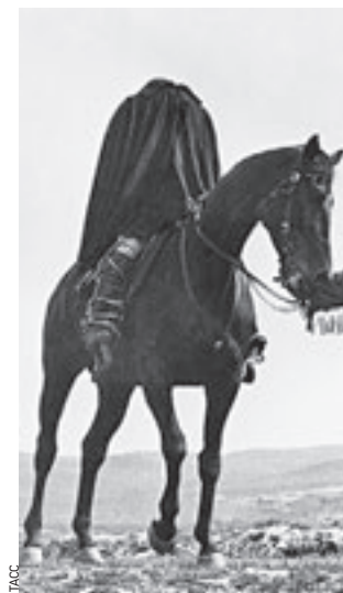
На уровне головы мальчикам накладывали бутафорские плечи