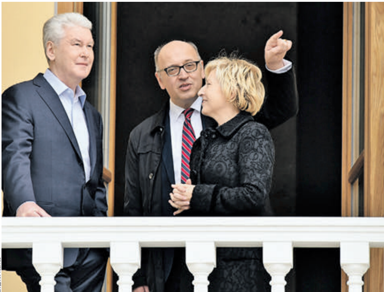
18 апреля 2016 года. Мэр Москвы Сергей Собянин (слева) вместе с послом Греции в России Данаи-Магдалини Куманак (справа) и переводчиком Димитрисом Яламасом (в центре) осмотрел здание посольства Греции после реставрации

Так, «Дом Мещерских» — двухэтажный особняк свет-