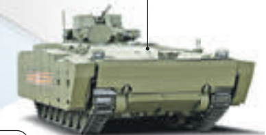
Боевая машина пехоты на платформе «Армата»

Предназначен для транспортировки мотострелков, ведения боя из машины и огневой поддержки пехоты