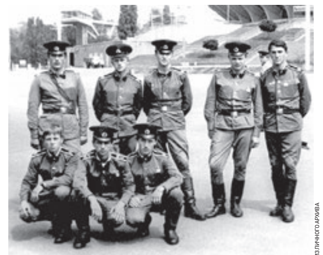
Июль 1986 года. 71-й взвод по дороге в Чернобыль — остановка в Киеве. Младшему бойцу было 25, а старшему — 54 года

мент необходимости вновь призванные на военную службу. 54-летний солдат пришел вместо своего сына: в военкомате сказал, забереите меня, и его взяли. Мы жили в 30-километровой зоне и каждый день на машинах ездили на работу на 4-й энергоблок. Первые две недели мы на АРСах — армейских авторазливочных станциях, — занимались дезактивацией подъездных дорог к реактору. Мы ездили по двое, набирали из водоемов воду и поливали дороги, потому что по ним непрерывно ездили бетономешалки, которые заливали фундамент под будущий саркофаг. Стояла 30-градусная жара, дороги все были пыльные. Работали в респираторах. Сергей Валерьевич, если бы можно было жизнь, как киноплёнку, отмотать на 30 лет назад, вы бы подписали то письмо? Безусловно. Даже несмотря на то, какие последствия это имело для здоровья? Я — 50-летний мужичок в самом соку. Ну а если серьезно, сегодняшние экстремалы-туристы, которые ездят на экскурсии в Чернобыль, делают величайшую глупость.