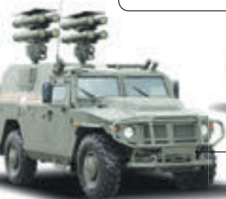
Самоходный противотанковый ракетный комплекс «Корнет-Д1» на базе автомобиля «Тигр»

Предназначена для уничтожения тактических ядерных средств, артиллерийских и минометных батарей, танков и другой бронетехники, разрушения фортификационных сооружений