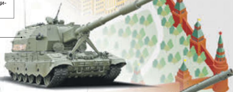
Средний танк Т-14 на платформе «Армата»

Предназначен для поражения танков и других бронированных целей, в том числе оснащенных современными средствами динамической защиты