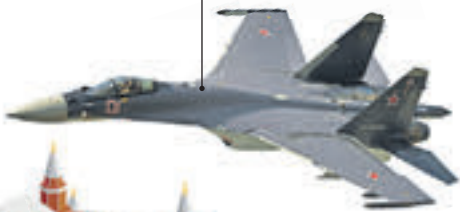
Новшества парада Победы-2016

Создан для транспортировки подразделений, их огневой поддержки, уничтожения легкобронированной техники