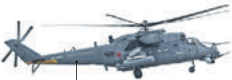
Многоцелевой транспортно-боевой вертолет Ми-35М

Следующая вечерняя репетиция парада на Красной площади пройдет 5 мая. Движение в центре Москвы будет ограничено с 16:00 и до окончания репетиций. По мере приближения колонн техники будут закрыты Красная Пресня, Баррикадная, Садовая-Кудринская, Триумфальная площадь, Тверская улица, Кремлевская набережная, Боровицкая площадь, Болотная улица, Болотная площадь, Моховая улица, улица Воздвиженка, Новый Арбат от улицы Воздвиженки до Новинского бульвара, Новинский бульвар.