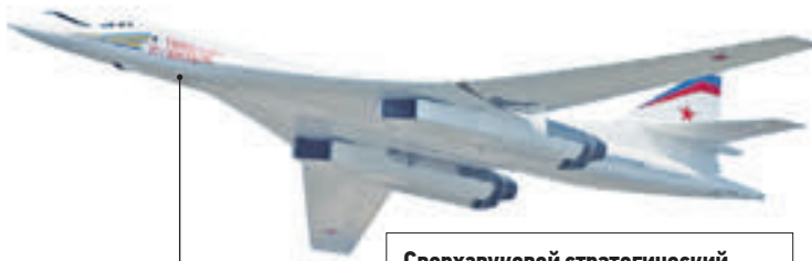
Сверхзвуковой стратегический бомбардировщик-ракетоносец с изменяемой стреловидностью крыла Ту-160

Су-35С обладает передовой информационно-управляющей системой, радиолокационной станцией, а также новыми двигателями разработки НПО «Сатурн»