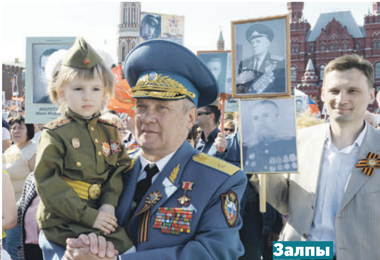
9 мая 2015 года. Тысячи москвичей приняли участие в шествии общественной организации «Бессмертный полк» по Красной площади

68 площадок станут центрами притяжения москвичей и гостей столицы