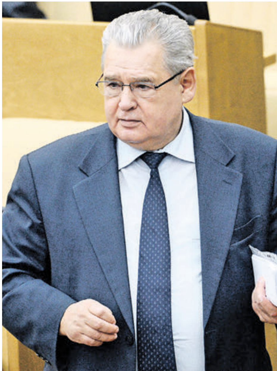
17 февраля 2016 года. Председатель комитета Государственной думы РФ по финансовому рынку Николай Гончар на пленарном заседании Госдумы РФ

— Мне кажется, что большинство автовладельцев остались все-таки недовольны. Но вот в Центральном административном округе ситуация совсем иная. Очень многие жители благодарны властям за введение платного парковочного пространства, — подчеркнул депутат. — До этого горожане не могли не то что припарковаться возле своего дома, но и даже выйти из подъезда — так близко стояли автомобили. Николай Гончар также отметил, что сегодня пар-