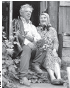
Писатель запретил родным переименовывать родное село

любил говорить о войне, его больше интересовали русский национальный характер и судьба крестьянства. Писатель хотел рассказать, как старался крестьянин сохранить любовь к земле, которую у него отнимали. Горячо любил Виктор Астафьев и родное село Овсянку, в своей эпитафии жене и детям он написал: — И ради Бога, заклинаю вас, не вздумайте что-либо переименовывать, прежде всего родное село.