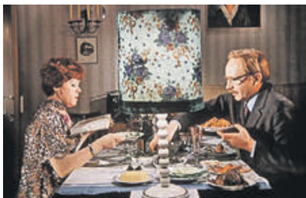
Алиса Фрейндлих и Андрей Мягков в легендарной кинокартине «Служебный роман»