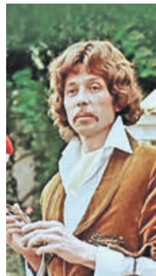
Один из незабываемых образов Олега Даля — принц Флоризель

«Ленфильма» специально для Даля создала костюмы, подчеркнувшие его фигуру. Расслабившись, Олег Иванович пошутил: «Вам кого сыграть: принца или Жоржика из Одессы?»