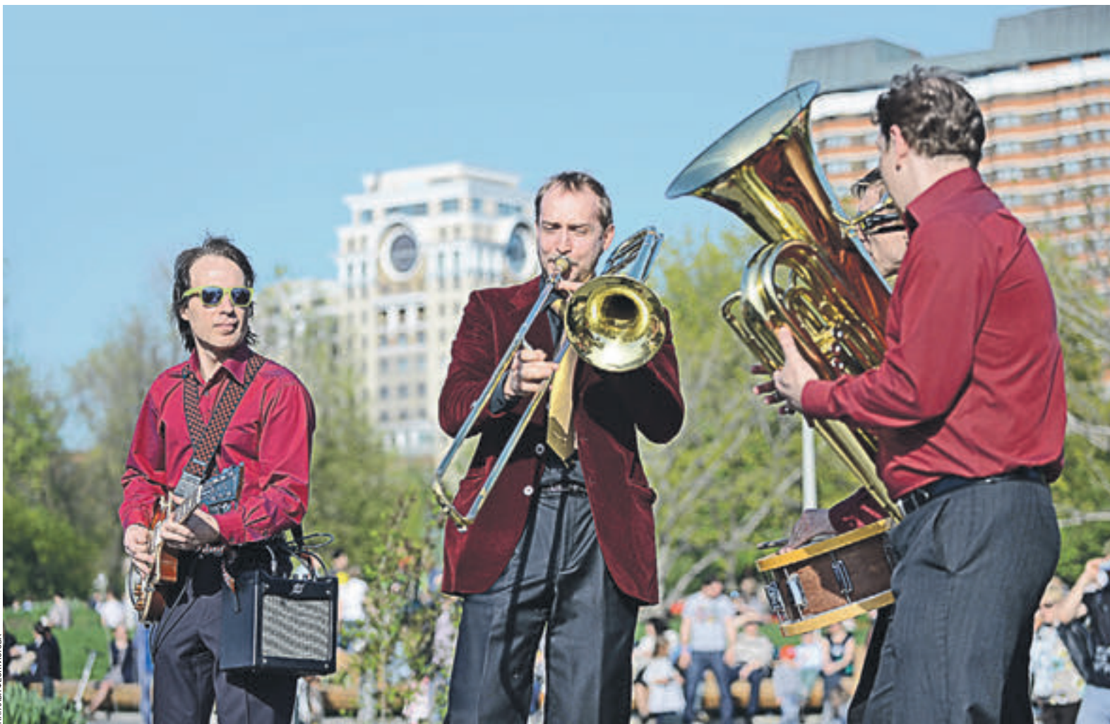
10 мая 2015 года. Праздничный парад «Шагающих оркестров» в парке «Музеон» в честь Дня Победы

1 июня стартуют прослушивания музыкантов в рамках проекта «Музыка в городе». Планируется, что в парках, и в пешеходных зонах столицы будут звучать песни уличных музыкантов и начинающих артистов. Проект уже вызвал немало споров. Вопрос в том, как будут отбирать музыкантов. И надо ли?