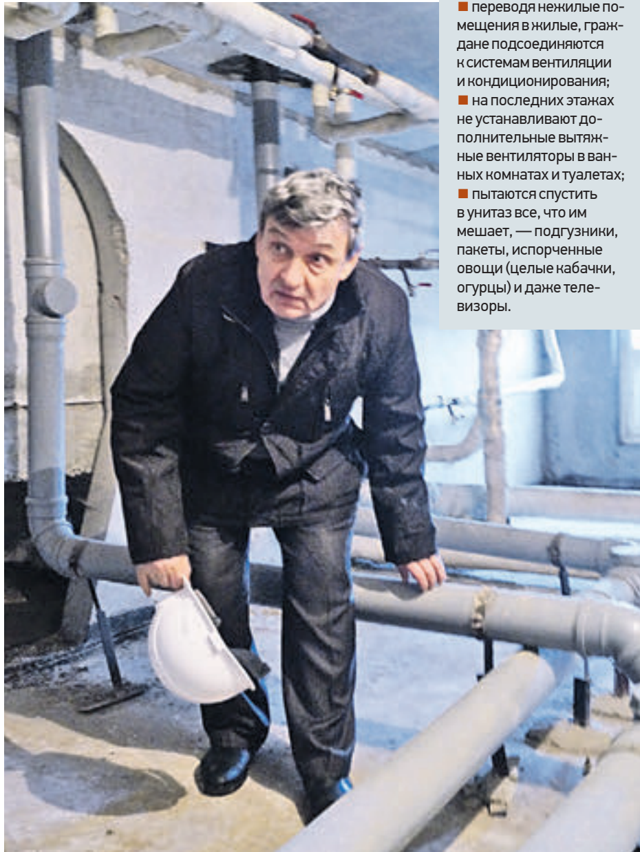
Бригада «МЦ» установила, что канализационная система в доме работает отлично. Причина неприятного запаха в квартирах многоэтажки — неаккуратное использование сантехники жителями