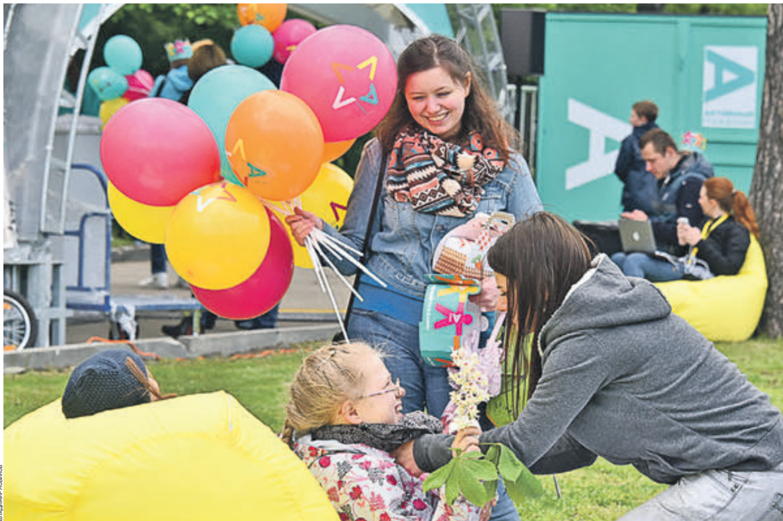
21 мая 2016 года. Участники праздника «Активный день» в специальной зоне отдыха на территории ВДНХ. Из 1700 проведенных голосований на портале «Активный гражданин» каждое второе получило конкретное решение