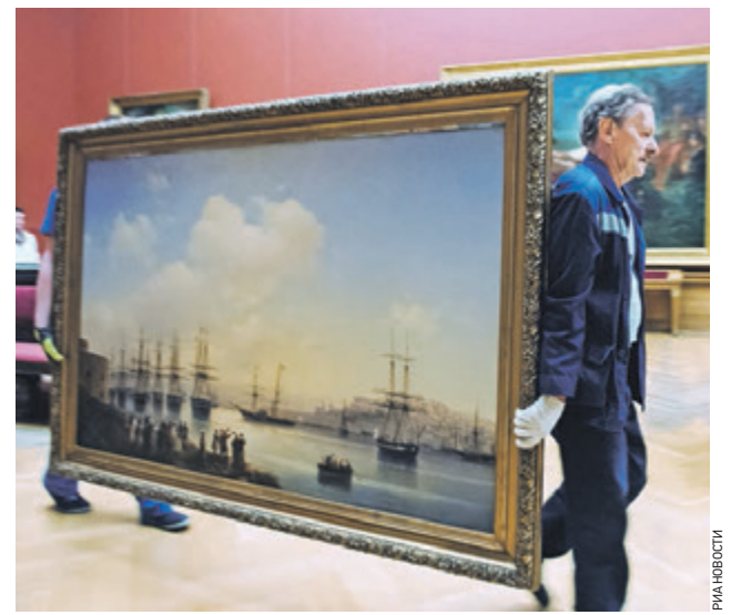
5 июля 2016 года. Сотрудники Русского музея в Санкт-Петербурге во время демонтажа экспозиции для отправки в Третьяковку