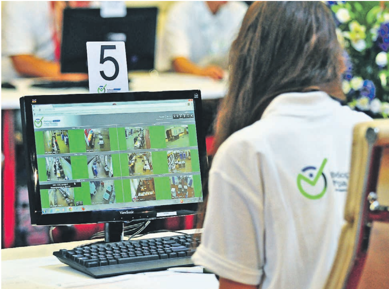
8 сентября 2013 года. Общественный наблюдательный штаб по выборам мэра Москвы на Берсеневской набережной. Система видеонаблюдения уже тогда была успешно реализована

Оперативно реагировать на нарушения поможет грамотная организация выборов