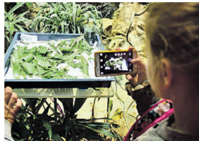
7 июля 2016 года. Тутовый шелкопряд вновь предстал перед посетителями Московского зоопарка