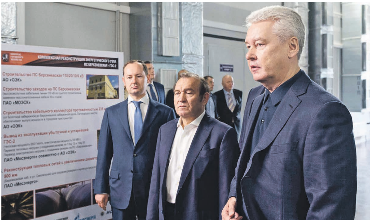
8 июля 2016 года. Мэр Москвы Сергей Собянин (справа), заместитель мэра Москвы по вопросам жилищно-коммунального хозяйства и благоустройства Петр Бирюков (посередине) обсуждают вопросы подготовки города к прохождению осенне-зимнего периода 2016/17 года.

Мэр дал поручение завершить подготовку к предстоящему отопительному сезону до 25 августа