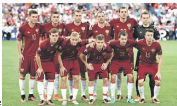
11 июня 2016 года. Российская сборная на чемпионате Европы по футболу перед матчем Россия — Англия

Что же касается домашнего чемпионата мира, кое-что можно успеть сделать. Надо добавить духа. У Хиддинка играли юные Березуцкие, Акинфеев и другие. Они стали старше и подустали. Нужна новая мотивация. Тогда кое-что получится. Не все, но станет полегче. Мнение автора может не совпадать с мнением редакции