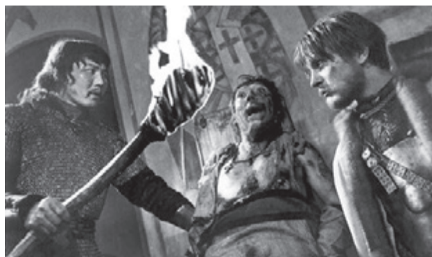
Кадр из кинофильма «Андрей Рублев». Эпизод о подвиге ключаря Патрикеева, посередине — Юрий Никулин

В этом году исполняется 50 лет фильму Андрея Тарковского «Андрей Рублев». Работа над лентой завершилась в 1966 году.