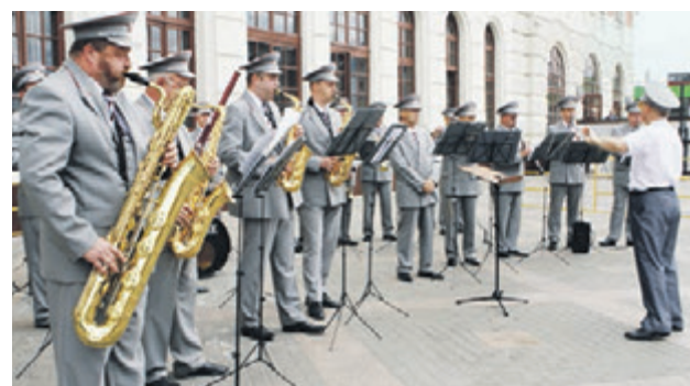
8 июля 2016. Оркестр Российских железных дорог выступает около Ярославского вокзала

— Музыканты начинают играть в то время, когда пас-