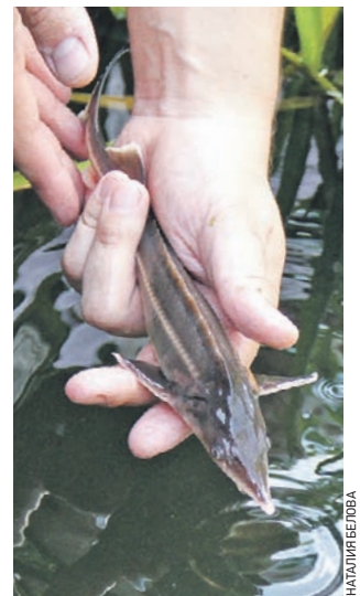
12 июля 2016 года. В бассейн «Аптекарского огорода» выпускают новых осетров