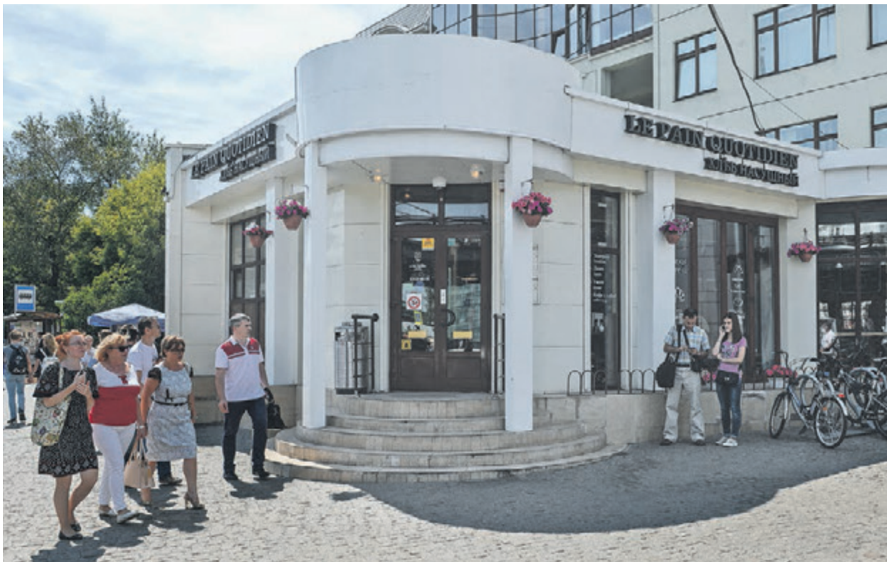
29 июня 2016 года. Кафе «Хлеб насыщенный» возле станции метро «Парк культуры» признано самостроем. Столичные власти обнародовали новый список объектов, подлежащих сносу