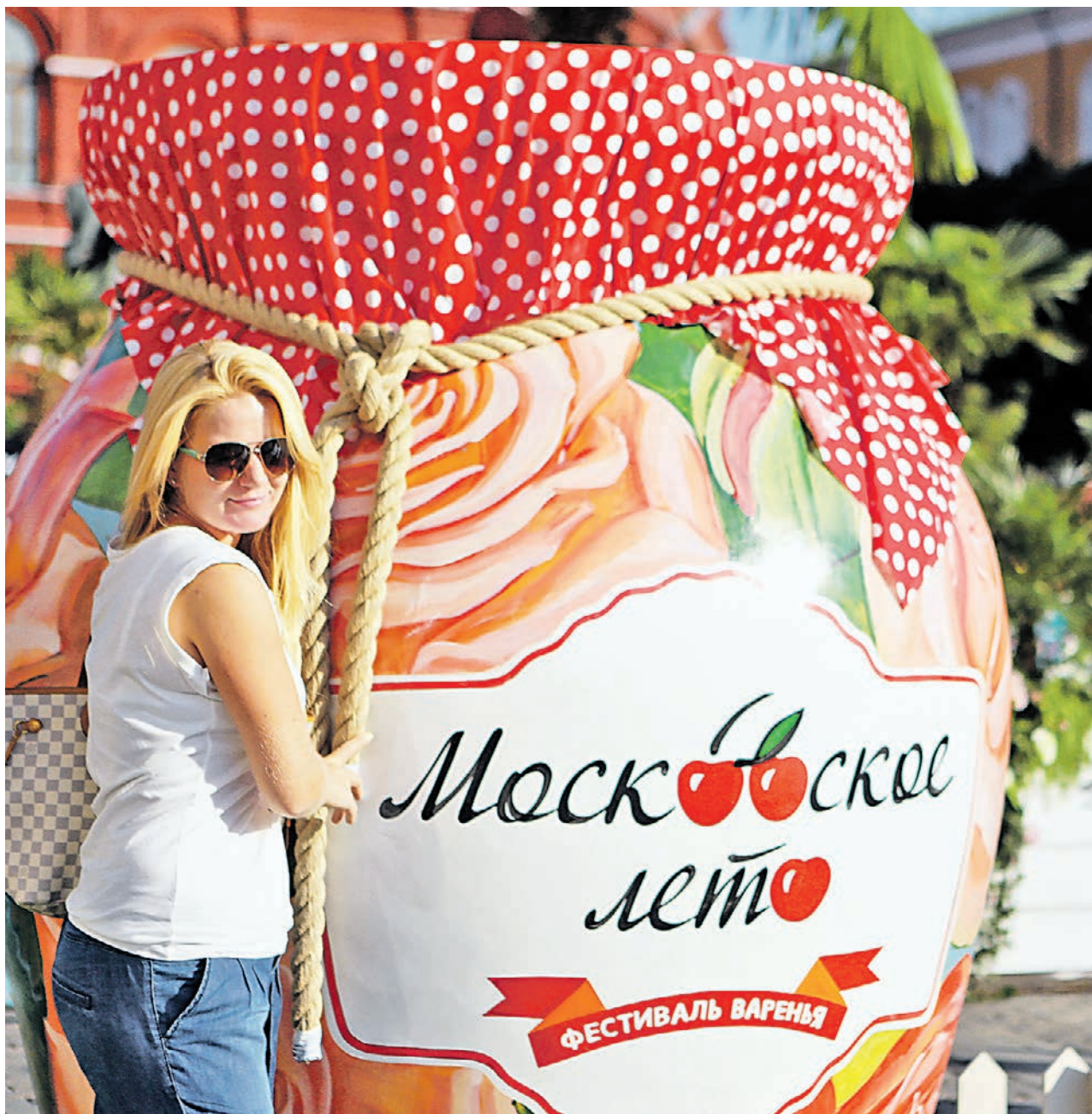
12 августа 2015 года. Площадка фестиваля «Московское варенье» накануне своего открытия. В этом году москвичи смогут попробовать в рамках фестиваля необычные сладости из цветов сирени, лаванды, черемухи

Сегодня столица встречает сразу два масштабных городских фестиваля — «Московское варенье» и «Дары природы»