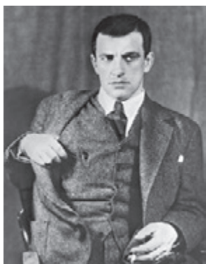
20 февраля 1924 года. Поэт Владимир Маяковский