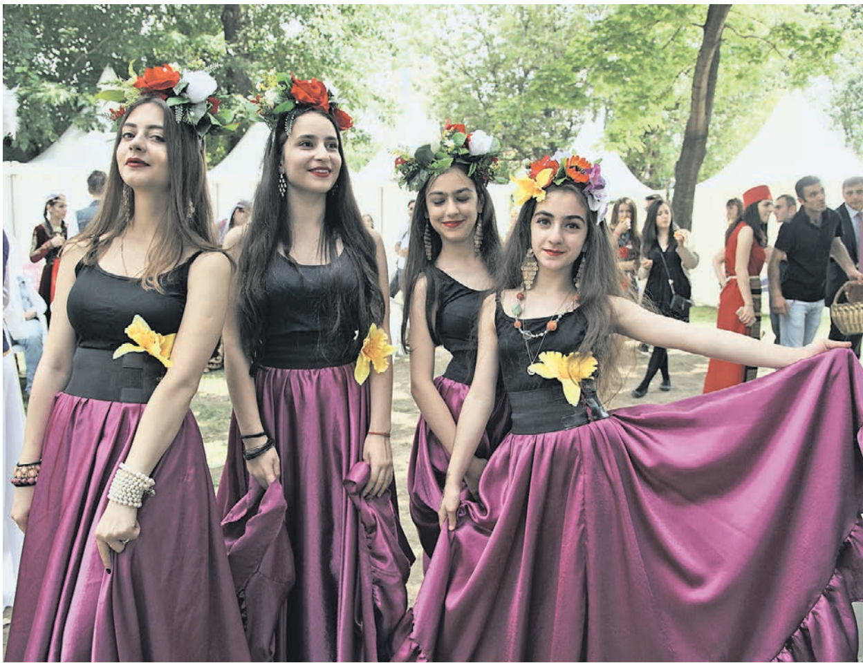
10 июля 2016 года. Девушки из армянского танцевального ансамбля «Айордик» готовятся к выходу на сцену, чтобы исполнить яркий национальный танец для посетителей межнационального праздника «Абрикос» в парке «Музеон»

В минувшее воскресенье в «Музеоне» прошел традиционный межнациональный праздник «Абрикос».