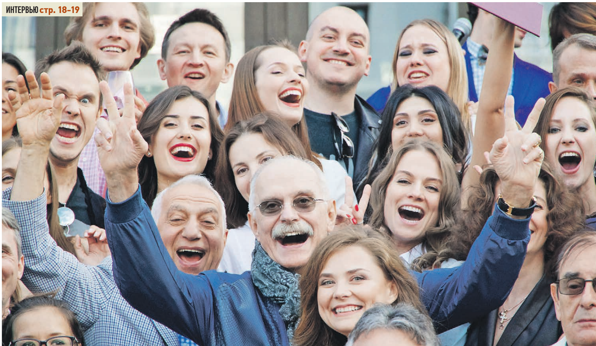
6 июля 2016 года. Первых выпускников академии, которая располагается в Театре киноактера на Поварской улице, поздравляли в торжественной обстановке. Основатель учебного заведения, режиссер Никита Михалков (в центре) лично вручал дипломы своим ученикам