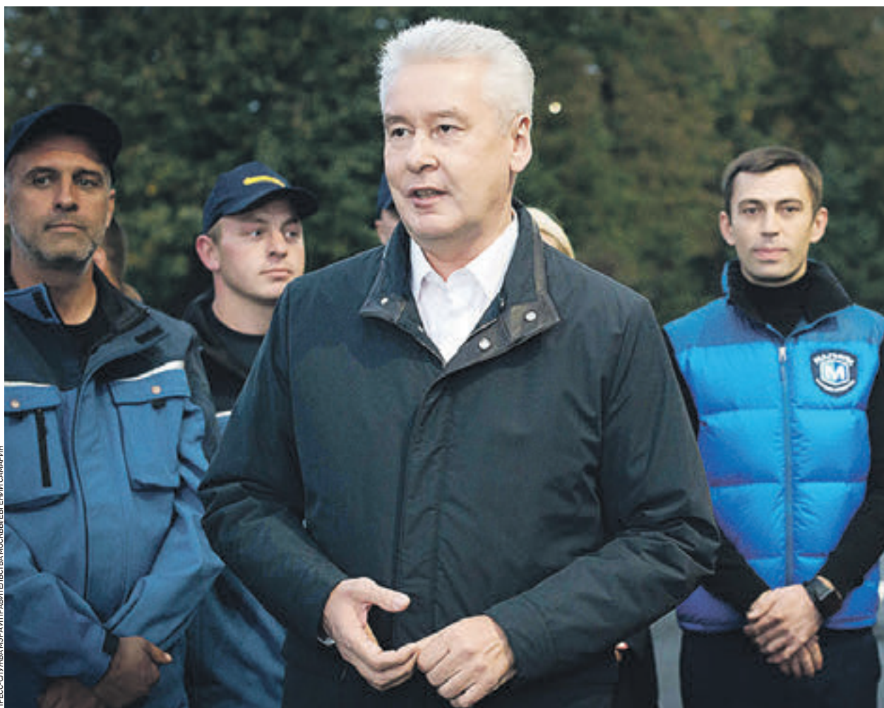
15 сентября 2016 года. Мэр Москвы Сергей Собянин осматривает итоги реконструкции Лужнецкой набережной. Сергей Собянин отметил, что набережная станет новым излюбленным местом для прогулок и спорта

— Мы продолжаем активную, масштабную реконструкцию «Лужников». На всей площади развернуты строительные работы, возводятся новые спортивные комплексы, обустроивается зеленая территория, дорожки, проспекты «Лужников», памятники культуры восстанавливаются, и постепенно появляются первые результаты. Вот таким первым результатом стала и Лужнецкая набережная, — сказал Сергей Собянин.