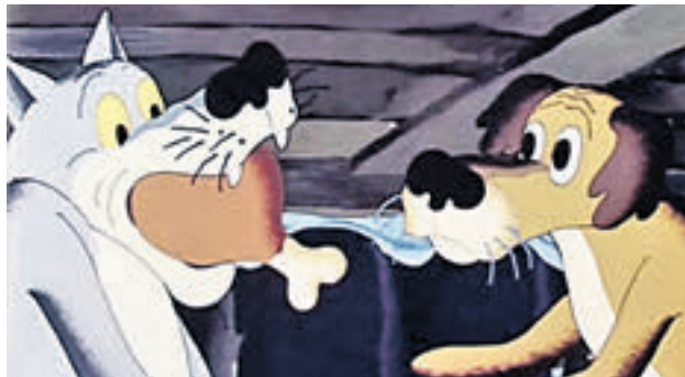
1982 год. Мультфильм «Жил-был пес». Пес (озвучивал Георгий Бурнов) кормит волка (озвучивал Армен Джигарханян)

11 сентября на 75-м году жизни ушел из жизни известный мультипликатор, режиссер и художник, создатель всеми любимого мультфильма «Жил-был пес» Эдуард Назаров.