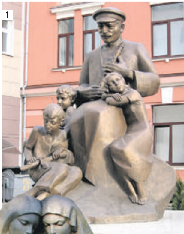
10 сентября 2016 года. Памятник дудуку «Песня Родины» в Москве (1). Скульптура «Единый крест» (2). Памятник, посвященный подвигу Соловецких юнг (3)