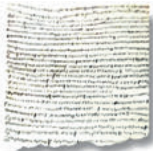
Документ, переписанный Александром Пушкиным

Проходящая по выставке, понимаешь, что Александр Пушкин, прежде чем написать «Капитанскую дочку», провел колоссальную историческую работу. Перед нами документ, переписанный