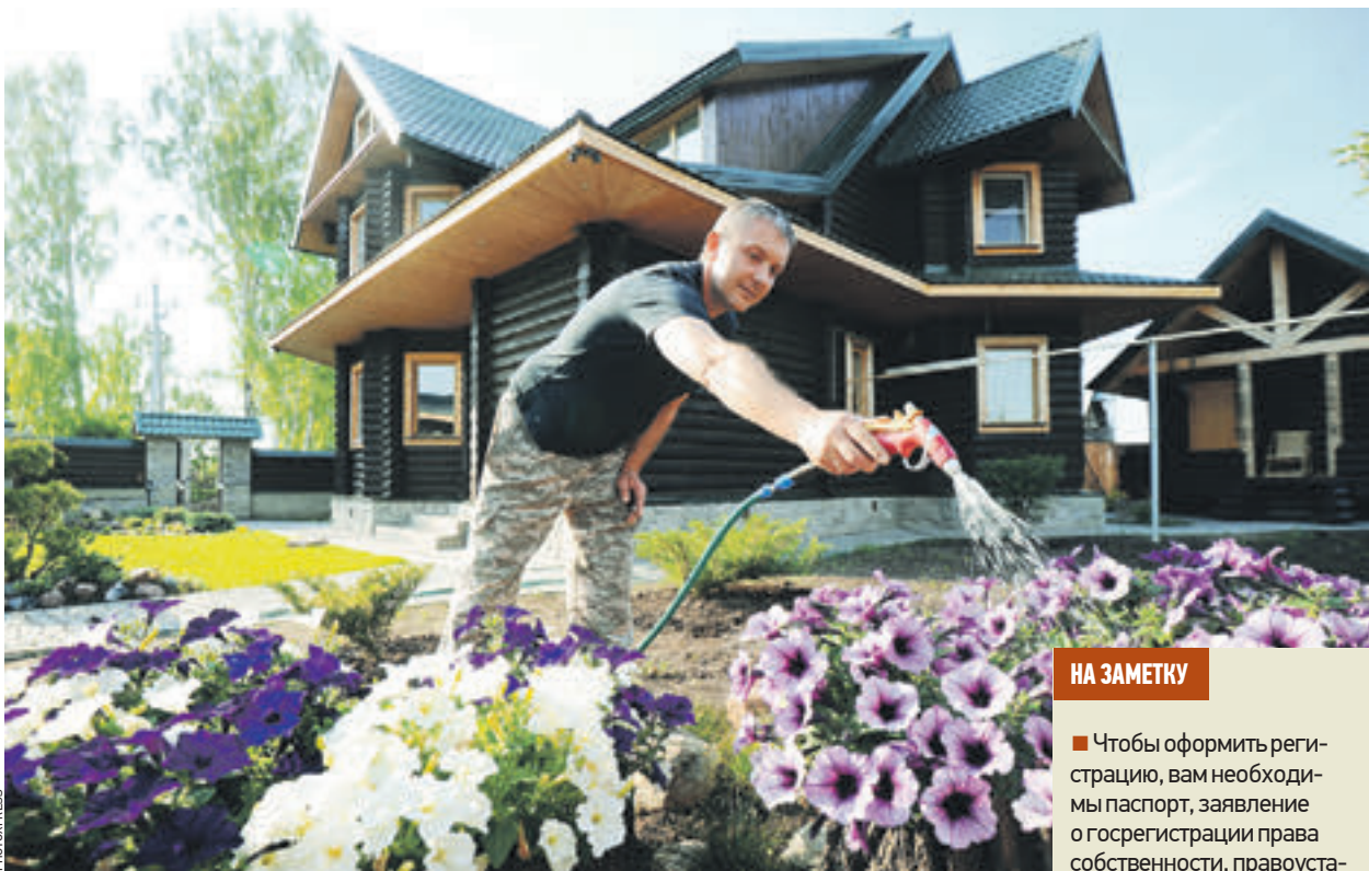
Июль 2016 года. Владельцам стоит поторопиться и зарегистрировать имущество до 1 января 2017 года, пока для этого требуется минимальное количество документов