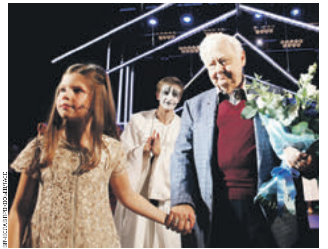
15 сентября 2016 года. Художественный руководитель театра Олег Табаков на открытии долгожданной «Сцены на Сухаревской»