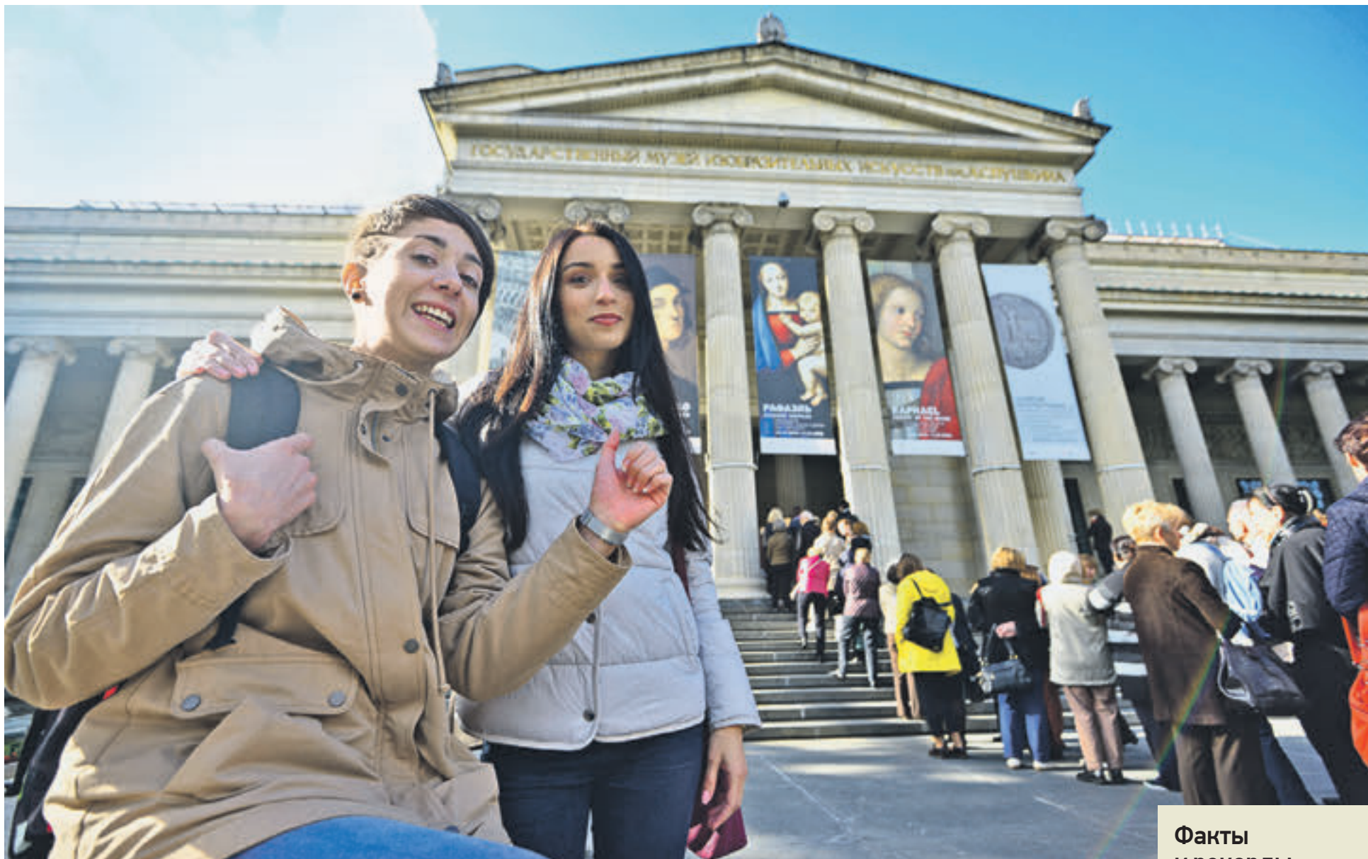
14 сентября 2016 года. Вход в Государственный музей изобразительных искусств имени А. С. Пушкина. На переднем плане две подруги — Даша из Москвы и Даша из Белоруссии (справа налево). Они не планировали посещать музей, но, как и многие, заинтересовались очередью и решили заглянуть «на огонек»

Новая тенденция — непонятно откуда взявшаяся тяга к великому — заставляет горожан оккупировать галереи. Недавно это явление коснулось и Пушкинского музея, где открылась выставка итальянского живописца Рафаэля Санти