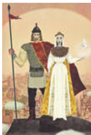
Кадр из мультипликационного фильма про князя Владимира