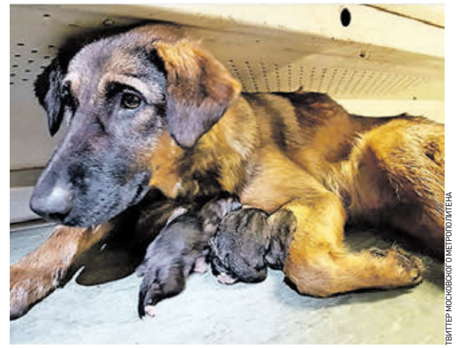
3 октября 2016 года. Собака по кличке Таганка с новорожденными щенками, одного из которых вы можете взять себе