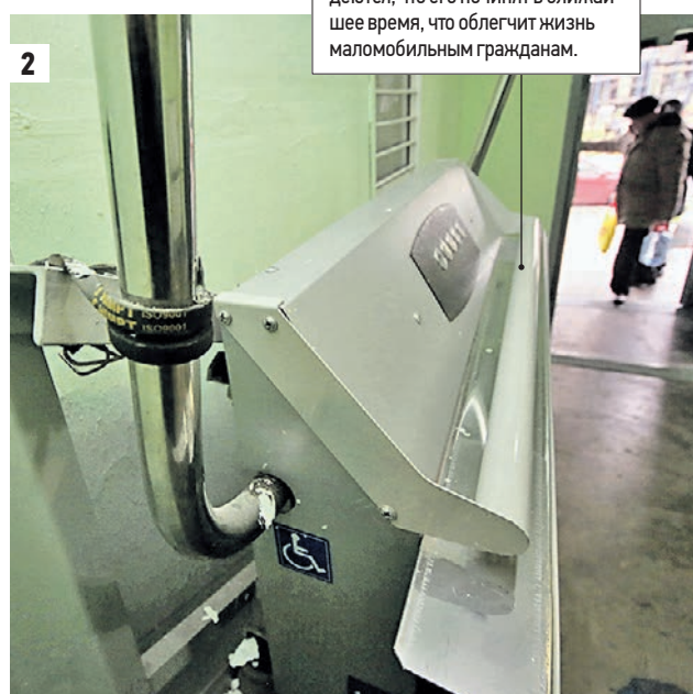
1 октября 2016 года. Павел, житель дома № 13 по Рогожскому Валу, показывает голый цементный пол, где, как уверены жители, должна быть плитка (1). Подъемник для инвалидов, установленный в подъезде дома (2)

Несколько лет назад в подъездах дома установили подъемники для инвалидов. Но вот в 6-м подъезде он так и не работает. Жители надеются, что его починят в ближайшее время, что облегчит жизнь маломобильным гражданам.