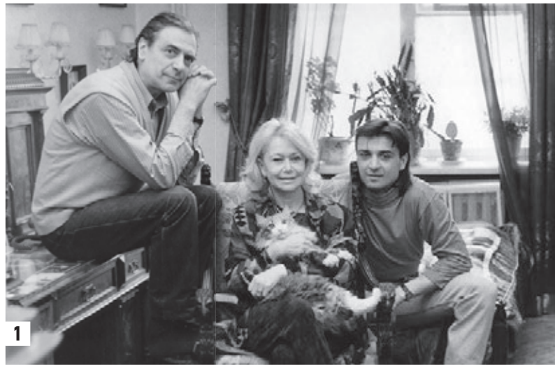
1 января 1990 года. Актеры отец (слева) и сын (справа) Александр и Александр Лазаревы и Светлана Немоляева (1). 14 декабря 2013 года. Актриса (4) в спектакле «Кант» (2). 2011 год. Кадр из сериала «Земский доктор. Жизнь заново» (3)