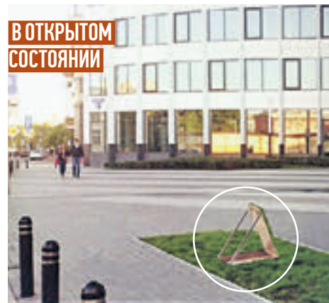
В ОТКРЫТОМ СОСТОЯНИИ

заявку на патент. Она будет рассматриваться в течение двух лет. Складная велопарковка, по словам молодого парламентария, крепится при помощи четырех металлических болтов и оснащается дренажной системой, кото-