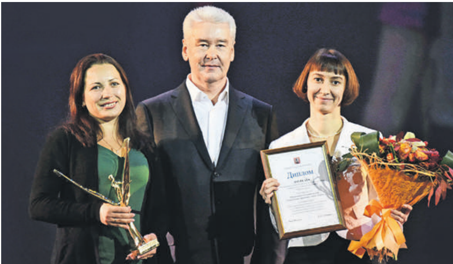
23 ноября 2016 года. Мэр Москвы Сергей Собянин в Кремле вручил памятные статуэтки городской премии «Крылья аиста» многодетным семьям столицы за вклад в развитие устройства детей-сирот

Мэр Москвы Сергей Собянин вручил премию «Крылья аиста» родителям, усыновившим детей