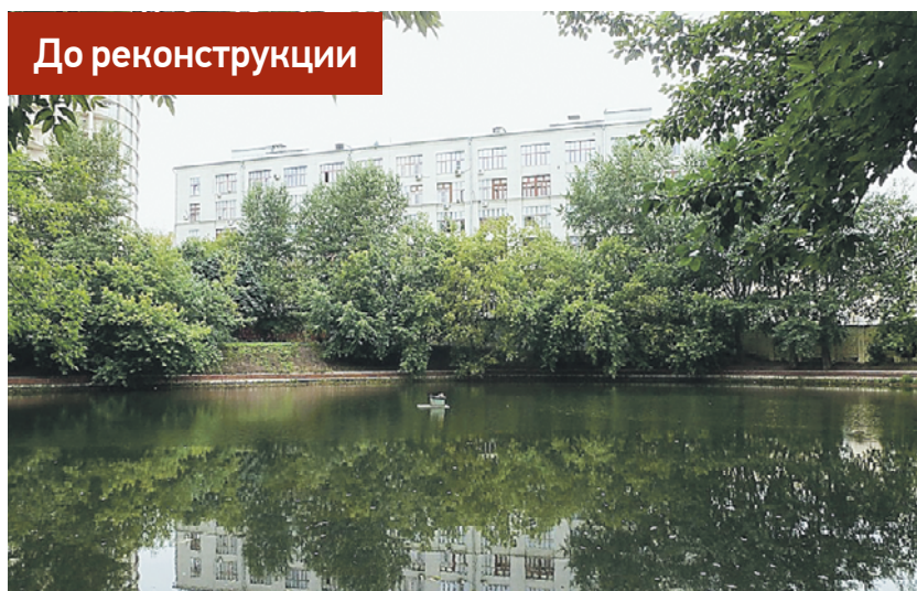
Вот так выглядели прибрежная часть Антроповского сквера и пруд до начавшегося благоустройства. Совсем скоро здесь все изменится к лучшему, и жители района смогут гулять в красивом и уютном парке