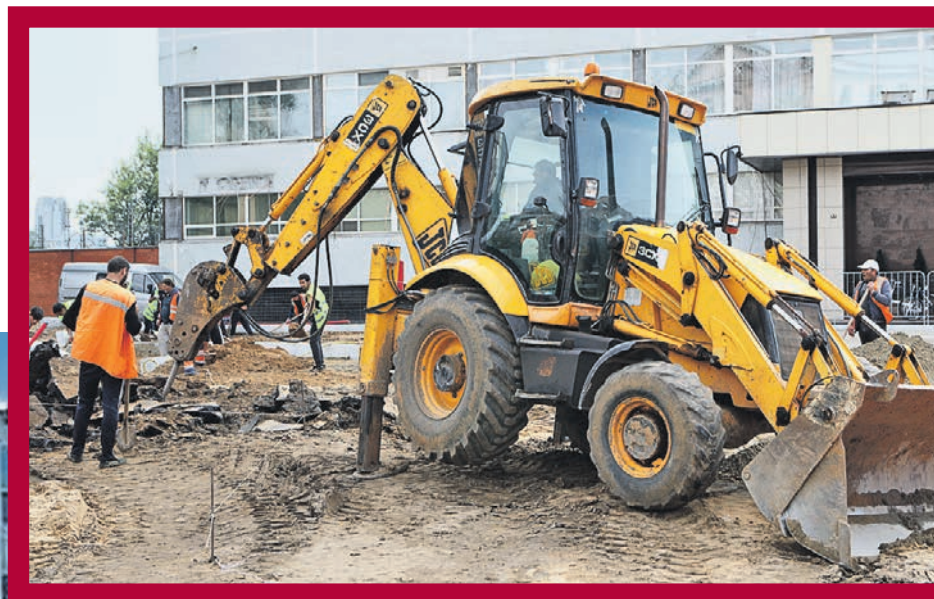
АГЕНТСТВО ГОРОДСКИХ НОВОСТЕЙ «МОСКВА»