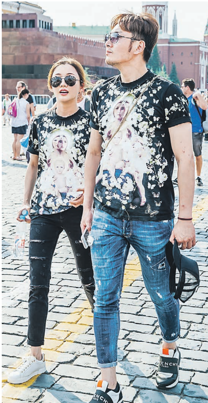
Туристы из-за рубежа и России приезжают в столицу чаще во время красочных фестивалей

— Многие районные площадки становятся не менее популярными, чем центральные. И вот такое распределение мероприятий по различным районам,