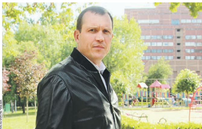
5 июля 2019 года. Префект ЦАО Владимир Говердовский во время осмотра парка «Усадьба Трубецких» в Хамовниках