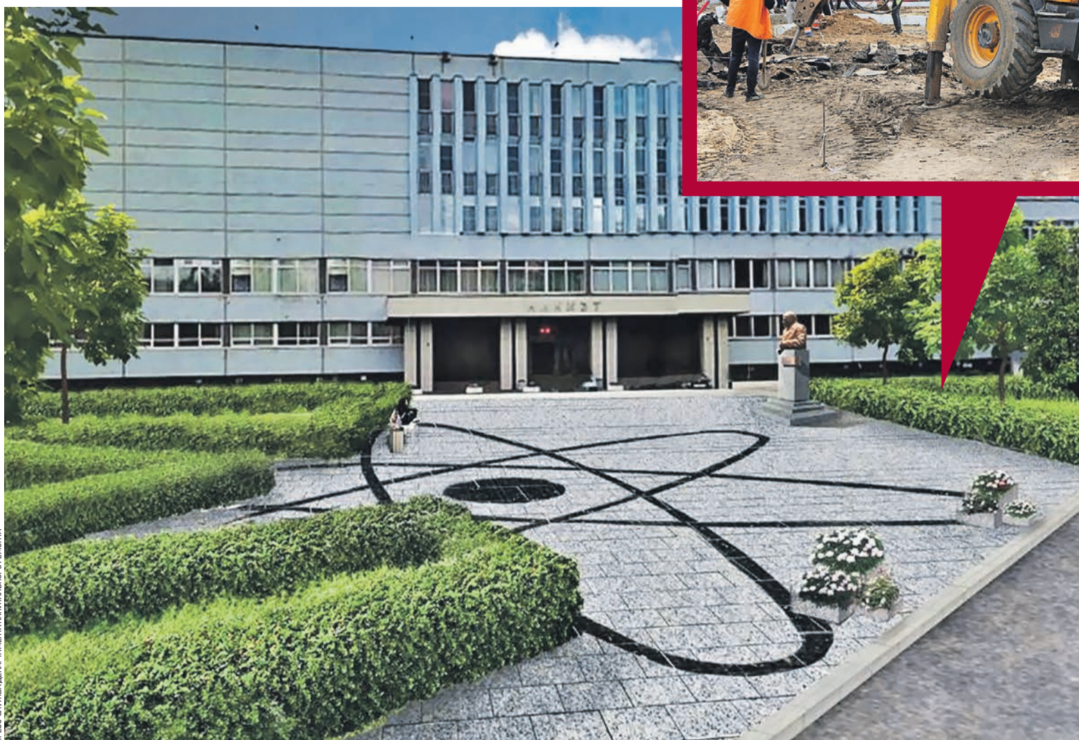
ПРЕСС-СЛУЖБА ДЕПАРТАМЕНТА КАПИТАЛЬНОГО РЕМОНТА

На площади перед НИКИЭТ имени Н. А. Доллежала появится памятник академику (проект благоустройства). Сейчас рабочие снимают старый асфальт с площади, чтобы потом сделать новое покрытие