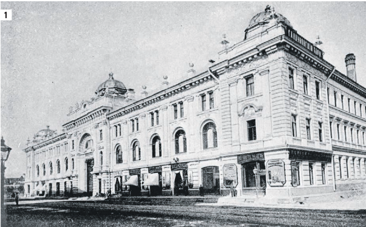
1 Главный корпус с банной частью и парадным мавританским двориком на Неглинной улице (1). 9 августа 2019 года. Потомственный банщик Виталий Солдатов (2). Интерьер зала высшего мужского разряда (3)

лил баню на мужское и женское отделения. А до этого времени все всегда мылись в одном помещении.