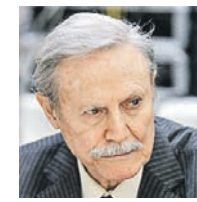
ЮРИЙ СОЛОМИН актер и режиссер театра и кино, художественный руководитель Малого театра

Я встаю рано и, чтобы никого не будить, вставляю в уши наушники. Прикрыв глаза, слушаю «Бизнес FM». Ко мне приходит кот и начинает меня лапой будить: он думает, что я сплю. А я не сплю. Я часто думаю о том, что совместный труд для взаимного уважения поколений — вещь очень перспективная. Поэтому у нас в театре много молодежи. Я в свое время прошел через все, в том числе и через подвалы, которые мы с женой снимали после окончания института в Москве в районе Сретенки, на Полянке. Снимали у одиноких старух. Этот опыт заставляет очень внимательно относиться сейчас к тому, что и как происходит в жизни наших молодых артистов. И думать: