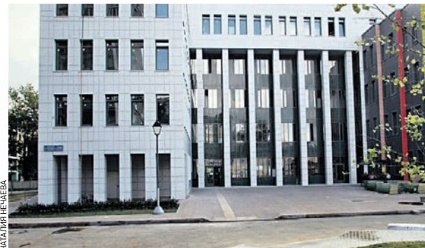
27 августа 2019 года. Работы на территории новой поликлиники и внутри здания на стадии завершения

Общая площадь здания составляет около 8,5 тысячи квадратных метров. Последние изменения в медико-техническое задание внесли в марте 2016 года и, несмотря на завершение к этому времени внедрения «Московского стандарта поликлиники» во всех взрослых амбулаторных центрах, не предусматривали такие существенные особенности, как открытая регистратура, медицинский пост, кабинет дежурного врача, манипуляционные для врачей общей практики, кабинет выписки рецептов, централизованную службу приема вызовов от жителей. Тем не менее, на этапе завершения строительства удалось внести целый ряд важнейших корректировок, которые соответствуют стандарту комфорта нового поколения «Московский стандарт +».