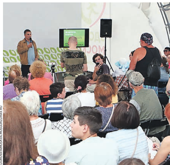
20 августа 2019 года. Врач Александр Мясников (в центре, на сцене) проводит лекцию в павильоне «Здоровая Москва»

Цель проекта — профилактика заболеваний. Тема эта востребованная, о чем говорит количество посетителей: в лектории «Здоровой Москвы» с момента запуска пришли более 6 тысяч человек, многие — не по одному разу. Занятия проходили на 13 площадках, параллельно можно было пройти обследование в «шатре здоровья» и позаниматься спортом. Лекции проводят как крупные организации (Лига здоровья нации, Московская служба психологической помощи населению и другие), так и эксперты в области ЗОЖ, в том числе главный врач Первой Градской больницы, телеведущий Алексей Свет и телеведущий, врач Александр Мясников. Кстати, лекции доктора Мяс-