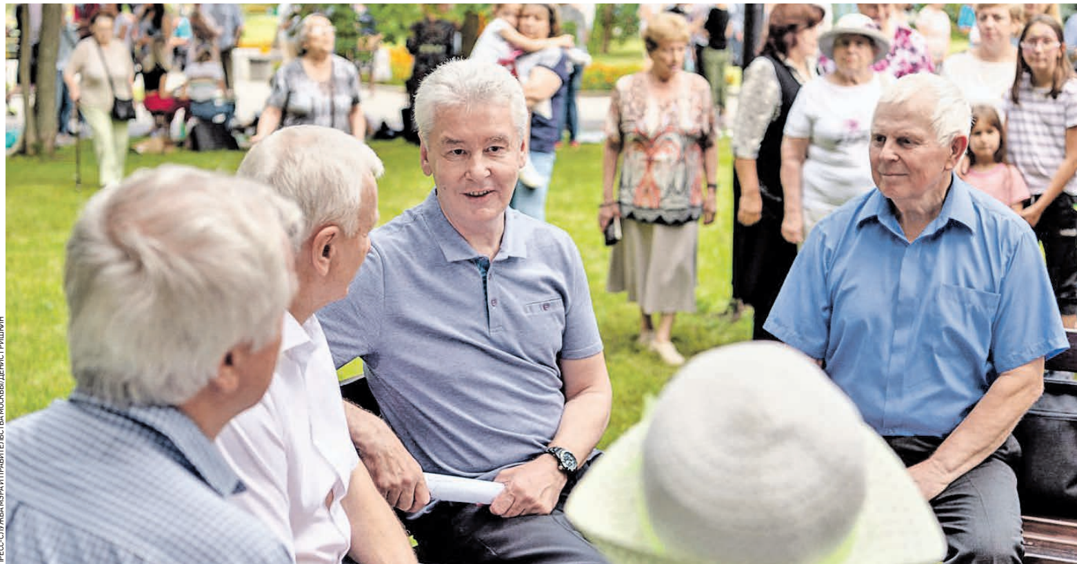
21 августа 2019 года. Встреча мэра Москвы Сергея Собянина (в центре) прошла в Зеленограде

вышения пенсионного возраста в стране столица сохранила все льготы не по факту выхода на пенсию, а по возрасту — для