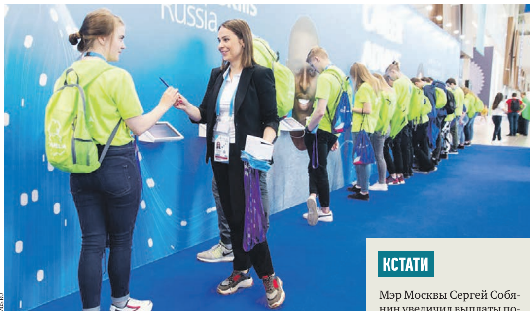
27 августа 2019 года. Участники команд — победительниц мирового чемпионата по стандартам WorldSkills оставили свои автографы на стенде

дитерское дело», «Ресторанный сервис» и других. Соревнования проходили с 22 по 27 августа в Казани, церемония награжде-