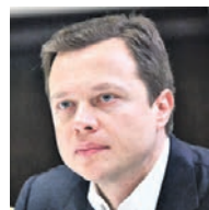
МАКСИМ ЛИКСУТОВ заместитель мэра Москвы по вопросам транспорта

Мэр Москвы поставил перед нами задачу установить на МЦД приемлемую стоимость проезда. Это необходимо, чтобы сделать новый вид транспорта максимально востребованным. Благодаря единой стоимости проезда на всех видах городского транспорта, а также бесплатной пересадке между МЦД, МЦК и метро при поездке в пределах города мы сможем интегрировать новое наземное метро в существующую систему городского транспорта, как когда-то это было с МЦК. Уверен, что принятые тарифы для проезда на Московских центральных диаметрах повысят востребованность этого вида транспорта у наших пассажиров.