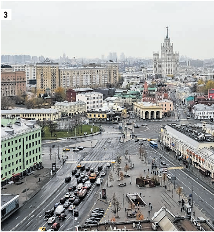
20 октября 2019 года. Голубевод Юрий Шмелев показывает своих любимцев — белых русских турманов (1). Он восстановил несколько пород голубей с помощью селекции, и теперь они живут под крышей 18-этажного дома на Марксистской улице (2). Отсюда открывается захватывающий вид на Москву (3)