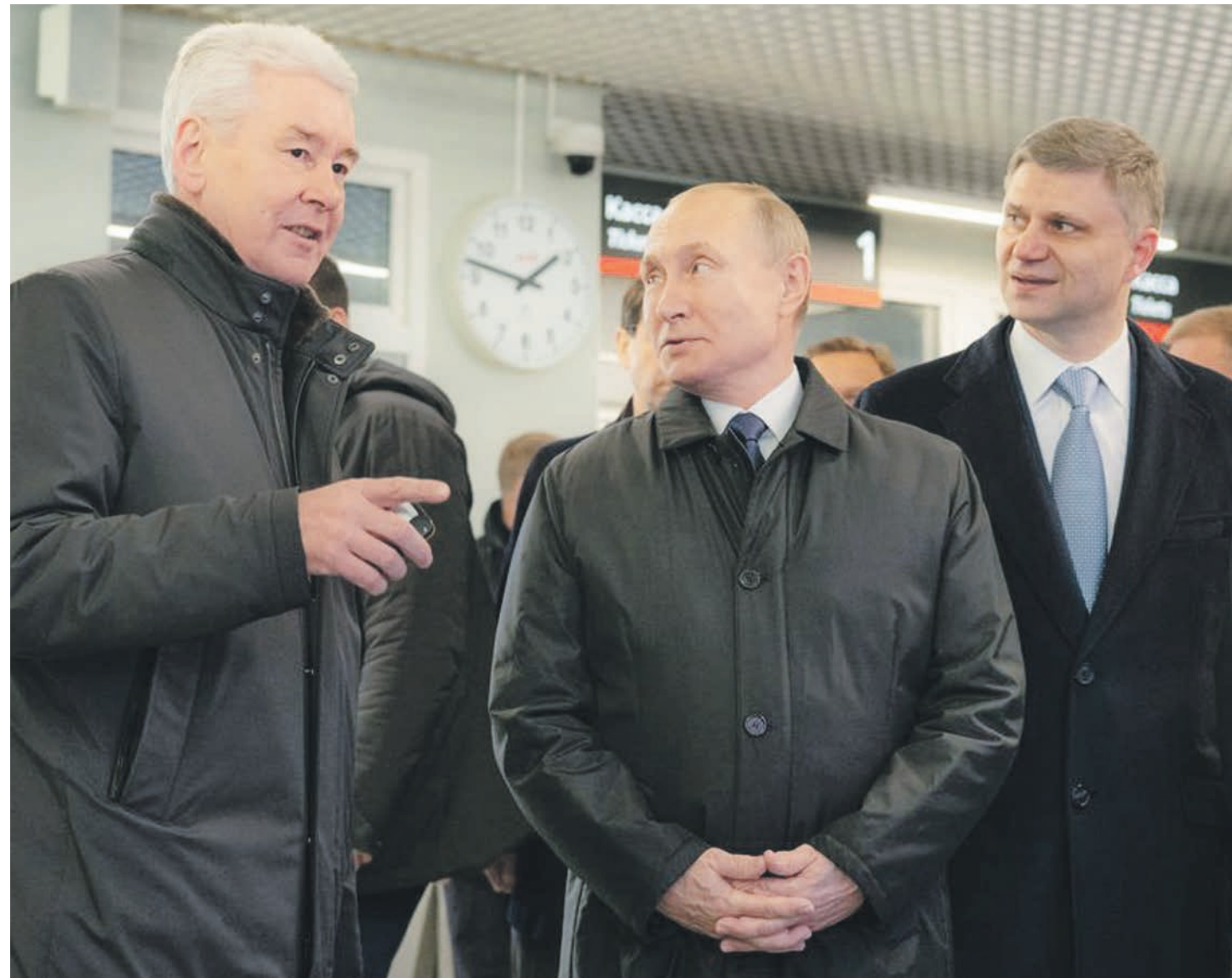
21 ноября 2019 года. Мэр Москвы Сергей Собянин, президент России Владимир Путин и глава «Российских железных дорог» Олег Белозеров (слева направо) на открытии первых направлений Московских центральных диаметров — МЦД-1 и МЦД-2