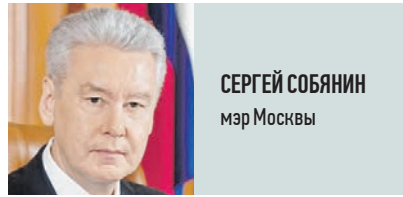
СЕРГЕЙ СОБЯНИН мэр Москвы

Новый бюджет получился социальным и — в то же время — бюджетом развития. По сравнению с предыдущим годом расходы на главные приоритеты города — здравоохранение и образование — значительно выросли. Соответственно, на 30,4 процента и 25,8 процента. Предусмотрены расходы на поддержку промышленности, малого и среднего бизнеса и инноваций. Все приоритетные программы будут выполнены. Принятый бюджет является гарантией устойчивого развития города. Благодаря депутатам Мосгордумы за конструктивную работу.