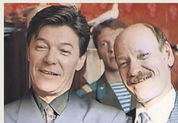
«ВСЕ БУДЕТ ХОРОШО»

Мини-сериал, вышедший в 1972 году по книге Георгия Садовникова «Иду к людям». Збруев сыграл второстепенную роль Григория Ганжи.