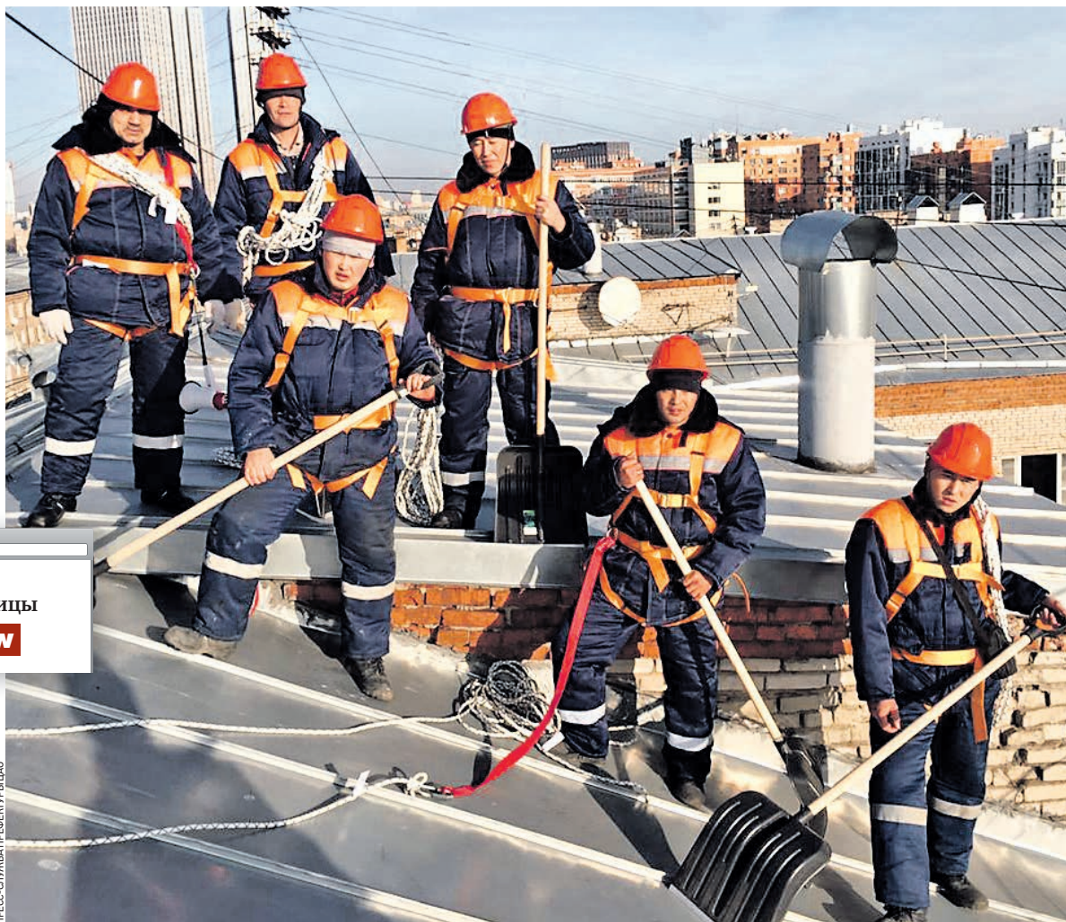
15 ноября 2019 года. Сотрудники «Жилищника Пресненского района» на тренировке по очистке скатной кровли многоквартирного дома

Ответственность за чистоту крыш домов зимой несут собственники зданий и управляющие организации. — Правилами Москвы предписано, что работы по уборке сосулек должны быть организованы незамедлительно, если мы говорим о скатных кровлях, выходящих на оживленные улицы. Собственнику дается два дня на