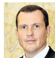
ВЛАДИМИР ГОВАРДОВСКИЙ префект Центрального округа

Очистка кровель от снега и наледи — одна из важнейших задач для нас в зимний период. От этого зависит безопасность людей. Мы прилагаем все усилия, чтобы работы проводились вовремя и качественно. Собственники зданий заранее получают уведомления от префектуры и управ, коммунальные службы также готовятся заранее.