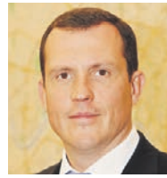
ВЛАДИМИР ГОВОРДОВСКИЙ префект Центрального округа

На территории Центрального округа находится около 10 тысяч магазинов, ресторанов и кафе. Им вручили 6,5 тысячи предписаний украсить заведения к Новому году и Рождеству. Всего силами частных предприятий будут установлены 57 искусственных елей высотой от одного до 22,5 метра. На данный момент они уже установили четыре ели — по одной на Красной площади и Новослободской улице и две — на Краснопрудной.