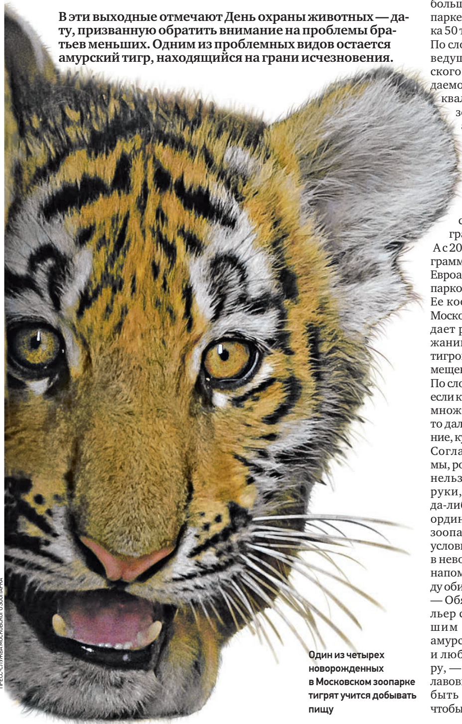
Один из четырех новорожденных в Московском зоопарке тигрят учится добывать пищу

В эти выходные отмечают День охраны животных — дату, призванную обратить внимание на проблемы братьев меньших. Одним из проблемных видов остается амурский тигр, находящийся на грани исчезновения.