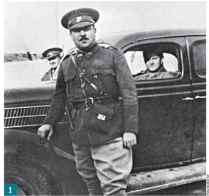
1 Мате Залка, он же генерал Лукач, в Испании весной 1937 года. 11 июня в эту машину попадет осколок (1). 17 марта 2022 года. Дом № 6 в Подсосенском переулке. Сарая во дворе, где жила семья Залки, давно нет (2).

Мате Залка печатался в СССР с 1924 года. Прозу он писал на родном языке, а потом редактировал перевод. А в последние годы пытался переводить сам. «На каждую страницу того, что было опубликовано на русском, он затрачивал не меньше сил, чем на пять страниц венгерского подлинника», — вспоминала вдова. Самым известным произведением Залки стал роман «Добердо» (1937) — о боях на