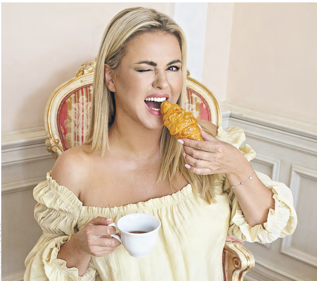
Певица, актриса и телеведущая Анна Семенович перепробовала множество рекомендаций по здоровому питанию. Своим опытом она поделится с участниками открытой дискуссии в рамках лектория «Здоровая Москва»