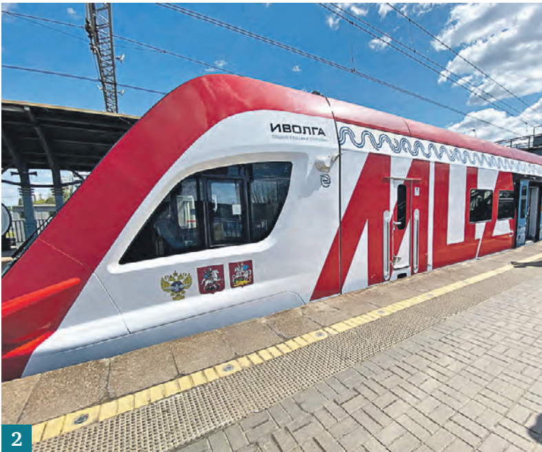
1 декабря 2021 года. Президент России Владимир Путин, мэр Москвы Сергей Собянин и главный инвестор проекта Леонид Михельсон во время открытия Дома культуры ГЭС-2 (1). Запуск МЦД позволил москвичам экономить время и финансы (2). Парк «Зарядье» стал визитной карточкой Москвы (3)

Одним из главных проектов последних лет стало, конечно, «Зарядье» — первый новый крупный парк в столице за последние почти семь десятилетий. На его открытие в 2017 году приехал президент России Владимир Путин. Новая территория отдыха молниеносно превратилась