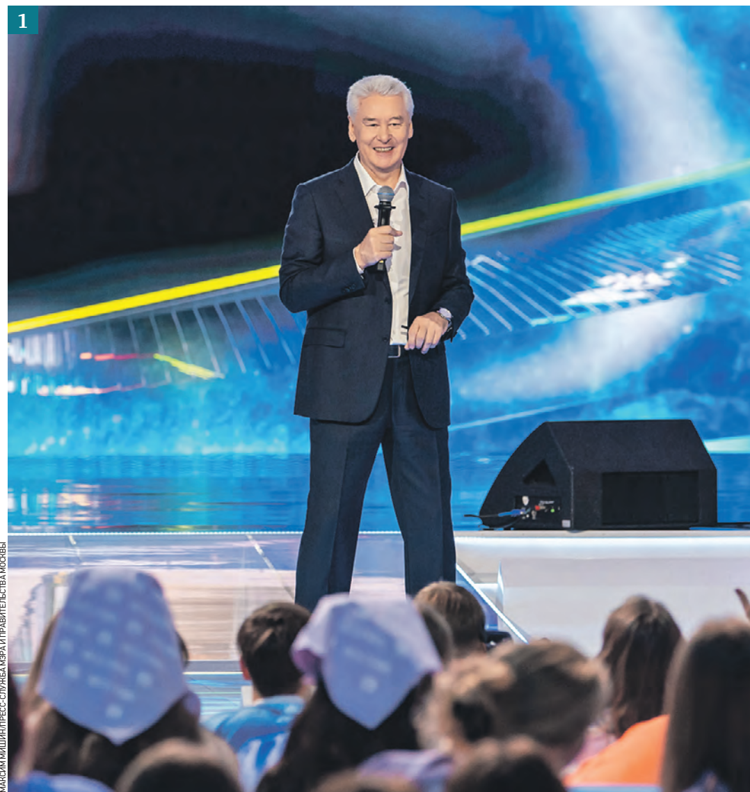
2 сентября 2022 года. Мэр Москвы Сергей Собянин выступил на просветительском форуме «Знание». Глава города рассказал о знаковых проектах, реализованных в столице за последние годы (1). Среди них — парк «Зарядье» (2)