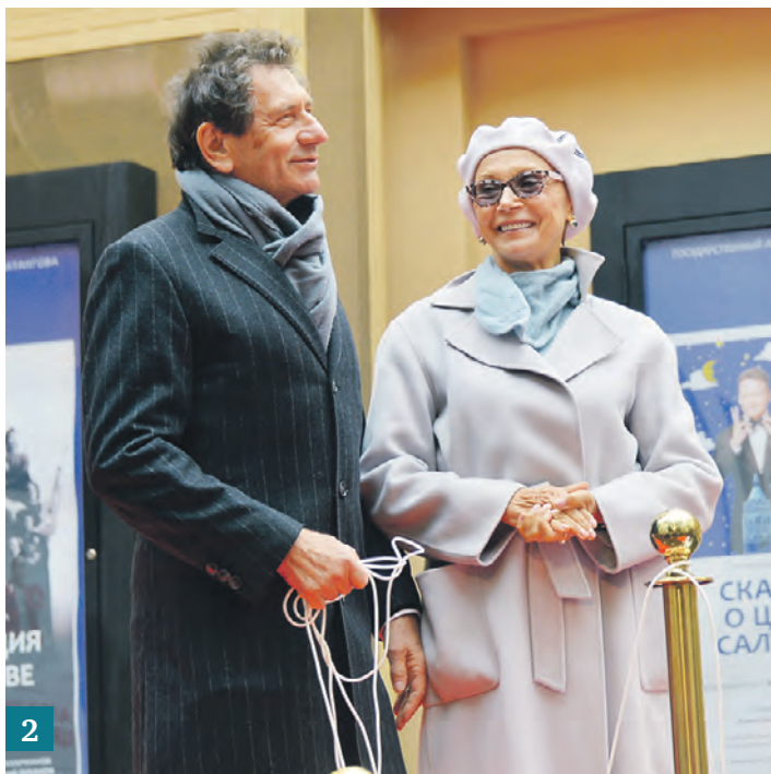
6 сентября 2022 года. Памятник Владимиру Этушу, Василию Лановому и Юрию Яковлеву (1) открыли Евгений Князев, ректор Театрального института им. Щукина при Театре Вахтангова, и вдова Ланового Ирина Купченко (2)

ИЗ ЭТИХ АКТЕРОВ Я ВИДЕЛ ВЖИВУЮ ТОЛЬКО ВАСИЛИЯ ЛАНОВОГО