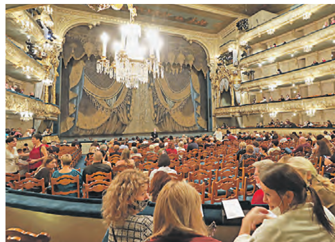
24 сентября 2021 года. Санкт-Петербург. Зрители в Мариинском театре. Онлайн-избиратели тоже могут обменять баллы на билеты на балет