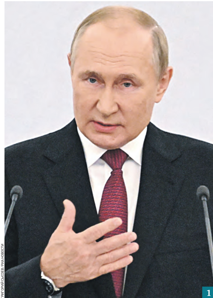
30 сентября 2022 года. Президент России Владимир Путин выступает на церемонии подписания договоров о вхождении в состав РФ ДНР, ЛНР, Запорожской и Херсонской областей (1). Более 180 тысяч человек присоединились к акции в поддержку исторического воссоединения (2)

Участники акции берутся за руки и скандируют: «Мы вместе!»