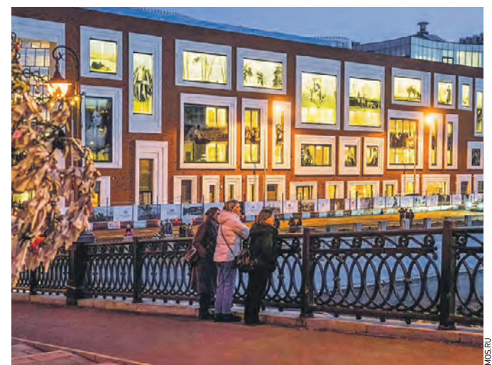
Набережная около нового корпуса Третьяковской галереи преобразится

— По завершении работ получится единый 20-километровый прогулочный маршрут вдоль Москвы-реки от Балчуга до Воробьевых гор, — заключил мэр.