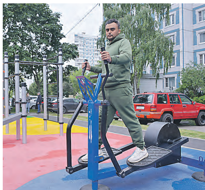
В самом благоприятном для проживания городе России каждый может заниматься спортом недалеко от дома.