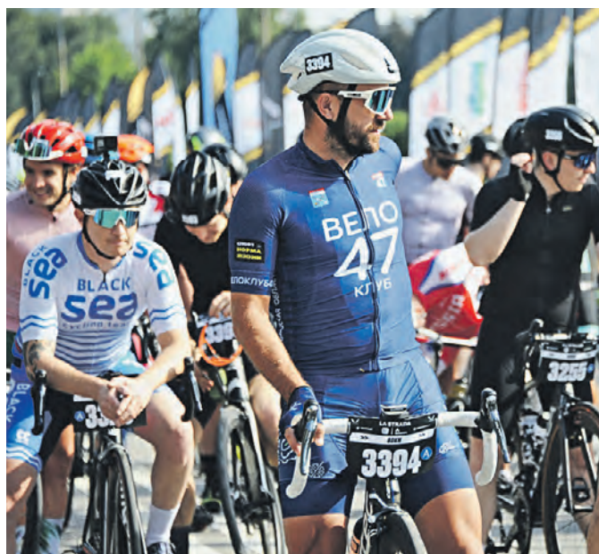
В разных велофестивалях ежегодно принимают участие десятки тысяч человек.