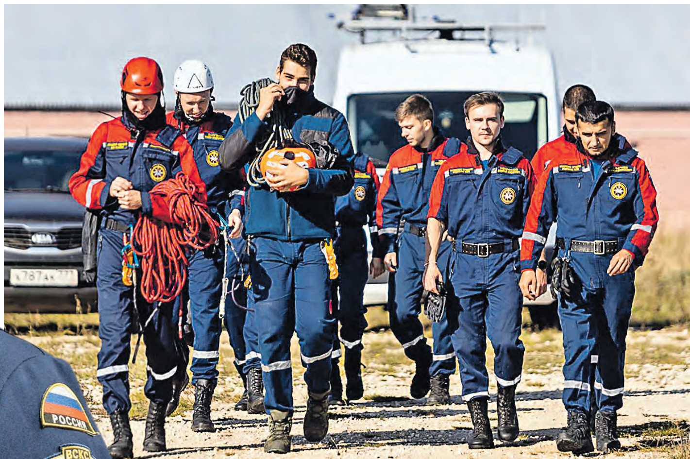
Члены Московского отделения Всероссийского студенческого корпуса спасателей на тренировке по десантированию во Владимирской области

Для этого организации необходимо пройти аттестацию на общественно-спасательные формирования. Один из наших отрядов имеет такую аттестацию. И как только организация аттестована и допущена к проведению спасательных работ, она встает в состав сил средств гарнизона. У этого отряда есть свое место базирования, свой гарнизон. Они подключены к уведомлениям о случившейся чрезвычайной ситуации и оперативно включаются в процесс помощи, присоединяясь к профессиональным спасателям. А как происходит подготовка новичков отряда и какие у них перспективы?