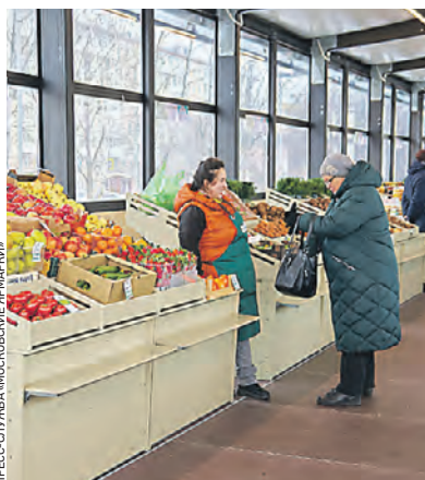
В ЦАО работают две ярмарки, самая популярная — на улице 1905 года

Сергей Собянин рассказал, что зимние ярмарки выходного дня с февраля посетили полмиллиона человек. Торговые площадки нового формата очень понравились горожанам. Они удобно расположены рядом с жилыми домами и остановками транспорта. С момента их открытия было продано 240 тонн продуктов.