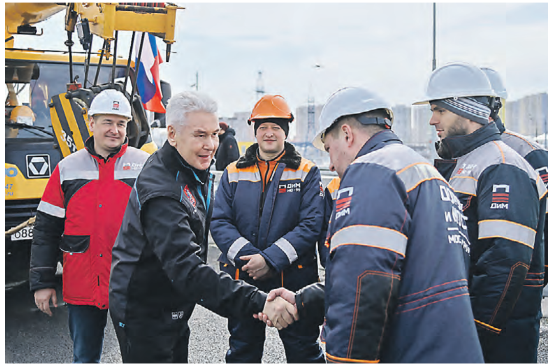
28 марта. Мэр Москвы Сергей Собянин поблагодарил представителей компании-подрядчика за удобную дорогу, которую сдали на полгода раньше срока

Каждый день мэр Москвы Сергей Собянин в своих социальных сетях рассказывает жителям столицы о наиболее важных городских событиях и масштабных проектах. Многие из них напрямую касаются жизни Центрального округа. Узнайте обо всем и на страницах «МЦ».