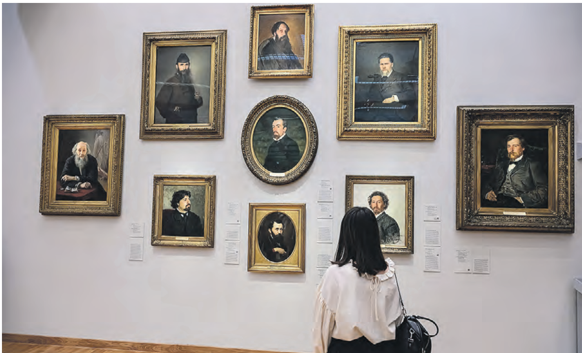
Благодаря искусственному интеллекту галереи могут отследить количество посетителей.

Мэр столицы Сергей Собянин рассказал, какие пилотные инновационные решения тестируются в городе.