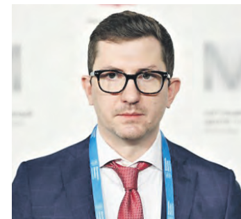
ИНФОРМАЦИОННЫЙ ЦЕНТР ПРАВИТЕЛЬСТВА МОСКВЫ