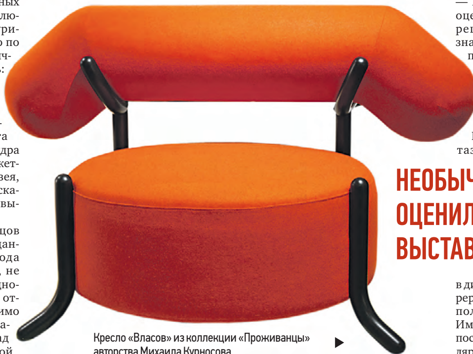
Кресло «Власов» из коллекции «Проживанцы» авторства Михаила Курносова

НАТАЛЬЯ НАУМЕНКО (текст) okrug@vm.ru