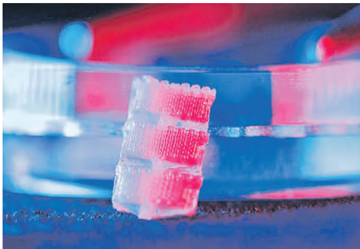
Нейроимплантат, запатентованный учеными университета МИСИС, поможет восстановить поврежденные нервные ткани спинного мозга

Схема работы сервиса проста. Сначала заказчик размещает запрос на платформе i.moscow. Затем заявка направляется конкретному исполнителю из списка «Техномаркета». Тот в свою очередь откликается на запрос и приступает к работе. К новому сервису уже присоединилось свыше 650 организаций, среди которых ведущие научные учреждения и университеты. В их числе и расположенные в центре НИТУ МИСИС и РХТУ имени Д. И. Менделеева.