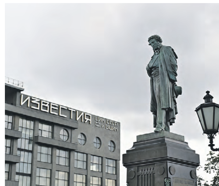
Бывшее здание «Известий» на Пушкинской площади