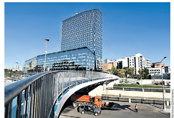
Велопешеходный мост, ведущий к научно-образовательному комплексу «Квантум парк» МГТУ имени Н. Э. Баумана, получил награду в этом году

Документы принимают до 15 февраля 2025 года. Церемония награждения победителей пройдет в июле. Ее приурочат к Дню архитектора. В этом году победителем в одной из номинаций стал проект велопешеходного моста около МГТУ имени Н. Э. Баумана.