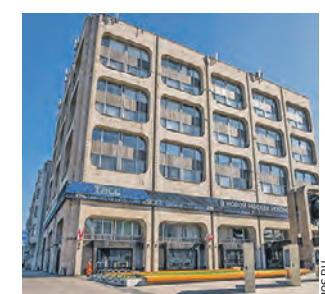
Сквер ТАСС перед зданием агентства

Территория перед зданием легендарного агентства по адресу: Тверской бульвар, 2, раньше была безымянной. Теперь она называется сквером ТАСС. Соответствующее постановление подписал Сергей Собянин. В этом году правительство Москвы дополнительно благоустроило эту территорию. Обновили пешеходную зону, установили медиаэкраны.