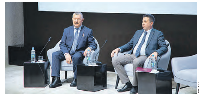
Вячеслав Сивко (слева), Герой Российской Федерации, гвардии полковник запаса

А в праздничный день, 9 декабря, молодежь совместно с военными, участниками СВО и ветеранами защитит память защитников Родины, развернув Знамя Победы.